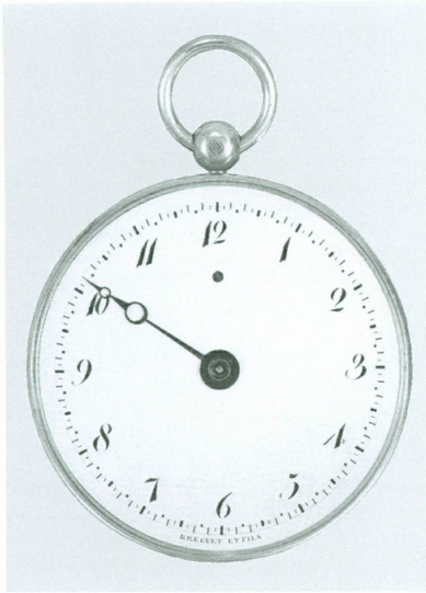
1. Abraham-Louis Breguet (Neuchâtel, 1747 – Paris, 1823) | Montre de poche, dite « souscription » , Paris, 1802 | Or, argent (inv. H 2006-101 [achat])

La campagne de reconstitution de la collection horlogère se poursuit, alimentée par des acquisitions qui sont, d'une part, des remplacements stricto sensu des objets portés manquants à l'inventaire en 2002 et, d'autre part, des appoints aux lacunes antérieures.