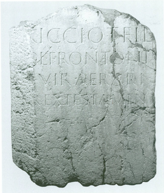
5 (à gauche). Inscription en l'honneur de T. Riccius Fronto, duumvir du trésor , Genève, seconde moitié du 1 er siècle ap. J.-C. | Pierre gravée, 81,5 × 66,5 × 65,5 cm (MAH, inv. EPI 426 [ILN, Vienne 851 (= WIBLÉ 2005, pp. 250-251)])