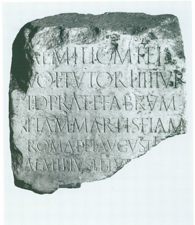
6 (à droite). Épitaphe de L. Aemilius Tutor, quattuorvir , Genève, 27 av. J.-C. – 14 ap. J.-C. | Pierre gravée, 68 × 71 × 41 cm (MAH, inv. EPI 184 [ILN, Vienne 849 (= WIBLÉ 2005, pp. 247-248)])