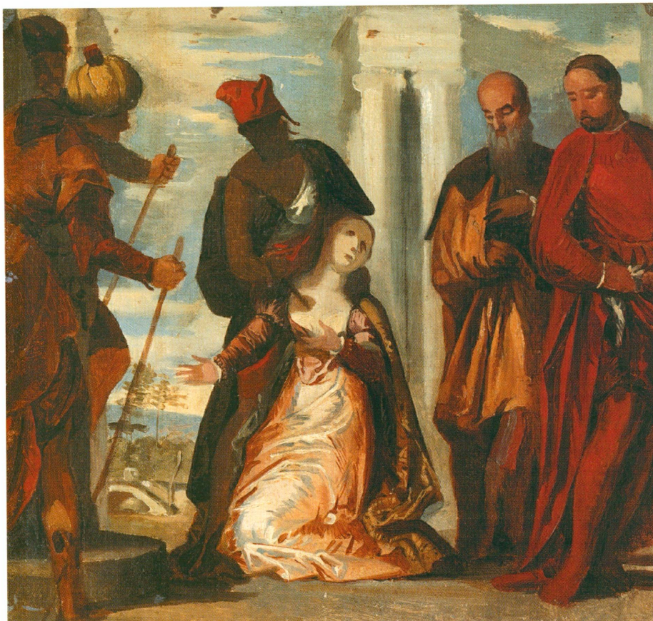
8. Barthélemy Menn (1815-1893) | Le Martyre de sainte Justine , 1835/1838 (?), d'après Véronèse (Florence, Galerie des Offices) | Huile sur toile, sur carton, 28 × 29,5 cm (MAH, inv. 1912-451 [legs Bodmer, Genève, 1912])

64. Voir Legs Bodmer 1912, p. 19: MAH, inv. 1912-463 à 1912-468; il pourrait toutefois s'agir de travaux de son assistant ou d'un élève qu'il aurait formé à l'enseignement.