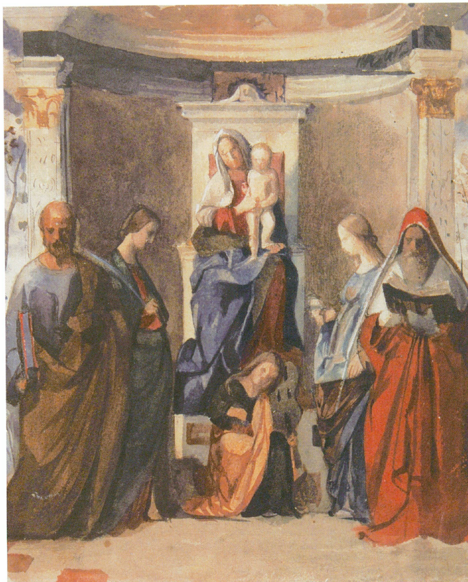
5. Barthélemy Menn (1815-1893) | Pala di San Zaccaria , 1835, d'après Giovanni Bellini (Venise, San Zaccaria) | Aquarelle et traces de crayon sur papier, 29,8 × 25,1 cm (MAH, Cabinet des dessins, inv. 1912-5919 [legs Bodmer, Genève, 1912])