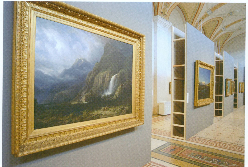
2 (à droite). Genève, Musée d'art et d'histoire : vue de l'exposition Patrimoine en danger · De Véronèse à Picasso , inaugurée le 29 novembre 2007

programme de revalorisation des fonds flamand et hollandais des XVII e et XVIII e siècles, dans la perspective de l'importante exposition qui leur sera consacrée à la fin de l'année 2009 : quinze tableaux, souvent de très grands formats, ont fait l'objet de traitements circonstanciés (fig. 3). L'intérêt suscité par cette campagne de restauration a conduit la Société des amis du Musée d'art et d'histoire à financer l'acquisition d'un équipement technique hautement spécialisé, une table aspirante couplée avec un système de chambre humide. En collaboration avec l'Unité d'histoire de l'art de l'Université de Genève, les ateliers de restauration de peinture et de cadre, le laboratoire et l'atelier de photographie, le Département a également poursuivi ses travaux de recherche dans la perspective de la publication du catalogue raisonné de ces peintures.