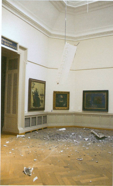
1 (à gauche). Incident du 31 août 2007 : effondrement d'une corniche dans la salle Bazinger, Musée d'art et d'histoire, Genève