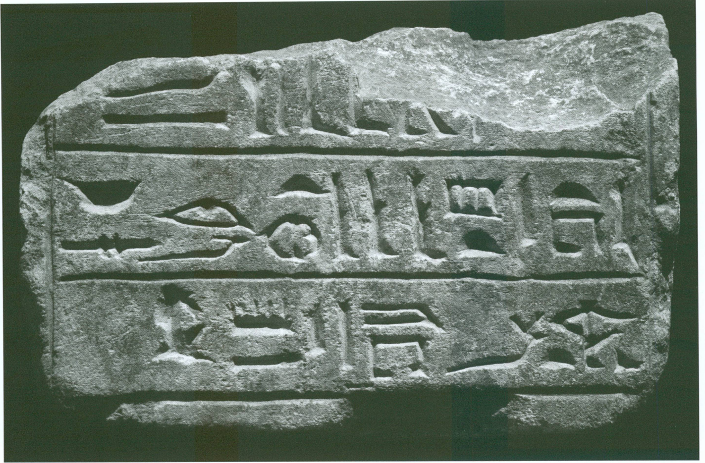
5. Partie inférieure d'une stèle en calcaire

Deux fragments de békhen inscrits pouvant appartenir au même monument proviennent également du voisinage immédiat de la porte orientale de la salle hypostyle du temple central de Thoutmosis III :