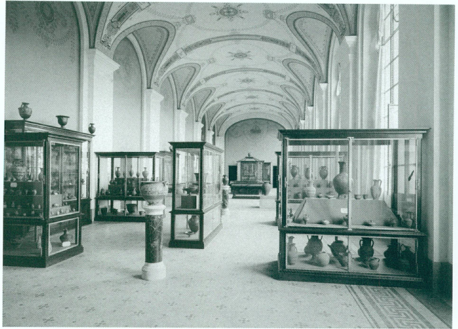
5. Salles des collections Fol et des antiquités romaines et barbares, vers 1910 | Négatif sur plaque de verre, 18 × 24 cm (MAH, Photothèque, inv. Bât. 26) | Au premier plan, vases antiques des collections Fol

chaleureusement tous ceux qui, par leur appui moral ou effectif, leurs conseils ou leurs communications, m'ont aidé efficacement, m'ont encouragé dans l'œuvre que j'avais entreprise [...]» 70 . » Nulle amertume, dans les propos de Fol ; peut-on alors vraiment prétendre que l'ouverture de son Musée fut un insuccès auprès du public ? Walther Fol a certes dû être déçu – mais comme tout homme qui a foi en la valeur de son projet – de ne pas assister à un véritable enthousiasme populaire et à un vif intérêt des scientifiques pour ses collections ; néanmoins, il nous semble qu'il n'en fut ni totalement surpris ni même découragé 71 .