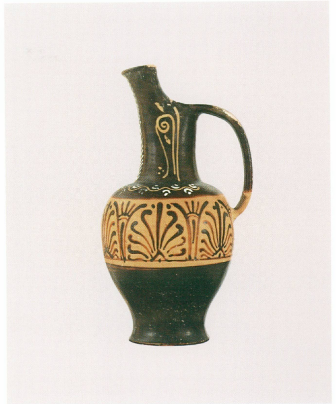
4 (à droite). Atelier du Groupe de Toronto 495 | Oenochoé, Tarquinies, 4 e quart du IV e siècle av. J.-C. | Céramique étrusque à figures rouges, haut. max. 28 × Ø 14,2 cm (MAH, inv. MF 247 [don Walther Fol, 1871])