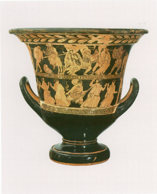
3 (à gauche). Peintre de Genève | Cratère en calice, vers 450 av. J.-C. | Céramique attique à figures rouges, haut. 39 × Ø embouchure 40 cm (MAH, inv. MF 238 [don Walther Fol, 1871])