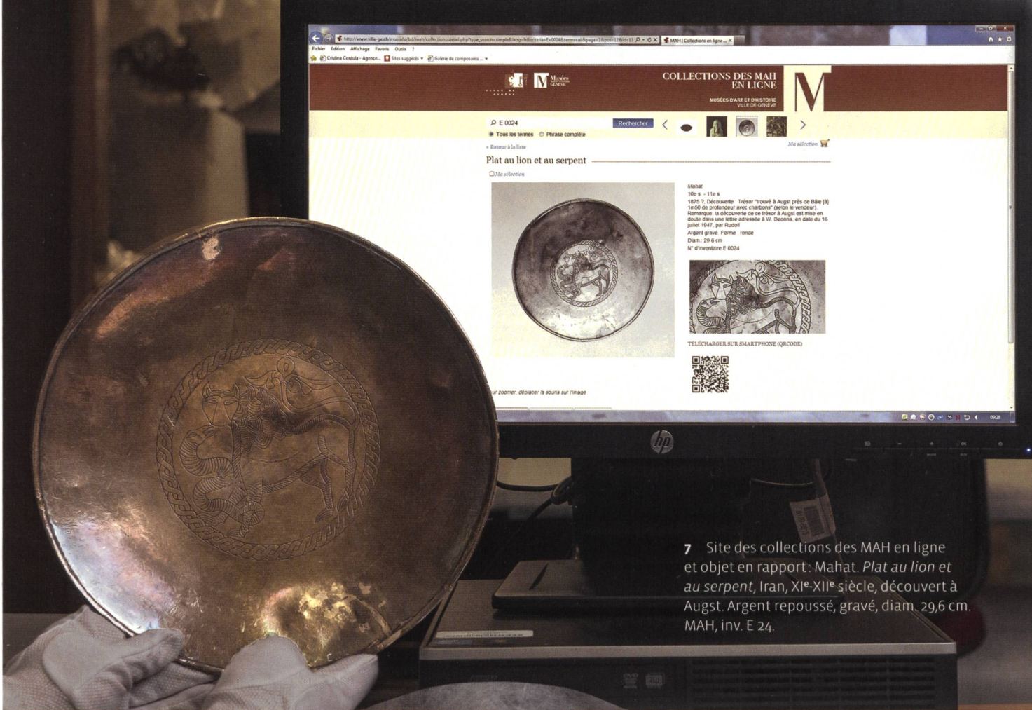
7 Site des collections des MAH en ligne et objet en rapport: Mahat. Plat au lion et au serpent , Iran, XI e -XII e siècle, découvert à Augst. Argent repoussé, gravé, diam. 29,6 cm. MAH, inv. E 24.

d'inventaire, de documentation photographique, de conservation curative et préventive, avant de regrouper toutes les collections dans un nouveau dépôt. De nombreuses autres institutions, notamment le Musée d'ethnographie de Genève, ont déjà expérimenté cette entreprise. Cela signifie traiter les objets un à un : contrôler s'ils sont déjà enregistrés informatiquement, établir leur fiche si ce n'est pas encore le cas, vérifier que les informations minimales sont saisies, effectuer une prise de vue documentaire si aucune photographie n'existe, enfin passer entre les mains des conservateurs-restaurateurs pour vérifier l'état sanitaire de l'œuvre en vue de sa maintenance. Le nombre de tâches à accomplir, multiplié par le nombre d'œuvres à traiter, donne un résultat légèrement vertigineux. Une seule constatation s'impose, il faudra aller vite!