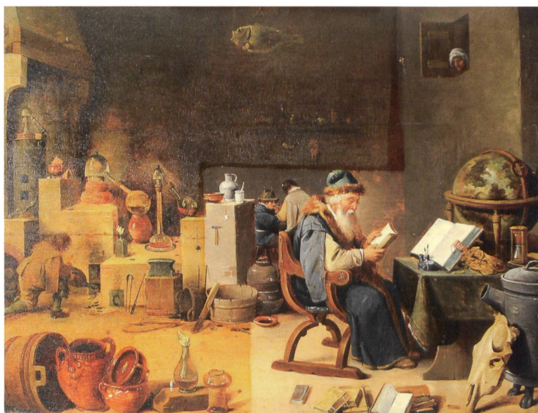
4 Vue de l'ensemble après le traitement.