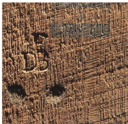
2 Initiales « FDB » du menuisier anversois François I de Bout (actif entre 1637 et 1643), frappées au revers du panneau (voir fig. 3 et 4).

Parmi les cas étudiés, une Vierge à l'Enfant de la collection Baszanger était considérée jusqu'à très récemment comme une œuvre brugeoise peinte autour de 1500 par le Maître de la Madone André. Or elle présente des incongruités matérielles : un parquetage fixé par l'avant du support avant la réalisation de la peinture, une séquence de travail et un choix de matériaux qui ne ressemblent en rien aux pratiques de l'époque, ainsi que des craquelures produites artificiellement. Au vu de ces observations, nous l'avons cataloguée comme une falsification du XX e siècle 2 . À l'inverse, et toujours dans ce même corpus d'œuvres, L'Alchimiste (fig. 3 et 4), inventorié comme une copie tardive de l'école française (XVIII e siècle) d'après le peintre anversois David Teniers, a pu être replacé dans l'atelier de ce dernier grâce à la date « 1639 » découverte lors du traitement de conservation-restauration, confirmée par les marques de fabrication du support, identifiant le menuisier François I de Bout, documenté à Anvers de 1637 à 1643 (fig. 2) 3 . Dans chaque cas, il convient de confronter les observations matérielles à celles déjà recensées par la littérature spécialisée et de les mettre en perspective dans une histoire des techniques et du métier de peintre, construite