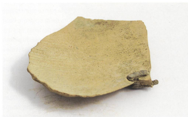
6 Tesson de céramique commune, découvert à Augst, époque gallo-romaine. Terre cuite, larg. max. 8,2 cm, haut. max. 8,1 cm. MAH, inv. 22412.

du médaillon une sorte de pastille en plomb, qui paraît être le reste du métal coulé à l'intérieur du pied pour le consolider. Le processus de restauration de cette coupe est le même que celui appliqué au cratère apulien.