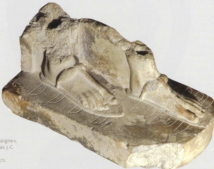
1 Pieds d'une statuette « porte-en-seigne », provenance inconnue, fin du XIV e s. av. J.-C. Calcaire, long. 22 cm. MAH, inv. 18160; don Walther Fol, 1871.

LES NOTIONS MODERNES DE CONSERVATION PRÉVENTIVE OU DE CONSERVATION CURATIVE N'AURAIENT AUCUN SENS DANS L'ANTIQUITÉ, MÊME S'IL NOUS FAUT CONSTATER QUE LES ANCIENS ÉGYPTIENS, PAR EXEMPLE, RECOUVRAIENT D'UNE TOILE DE LIN LES PLUS PRÉCIEUX OBJETS D'UN TROUSSEAU FUNÉRAIRE 1 ET QU'À APHRODISIAS, EN CARIE, UNE STATUE ÉQUESTRE UNIQUE FUT ÉRIGÉE SOUS L'EMPIRE ROMAIN À UN NOUVEL EMPLACEMENT ET RÉPARÉE À CETTE OCCASION 2 . L'ACTION DE RESTAURER, RENOUELER, RÉPARER, ADAPTER MILLE ET UN ARTEFACTS POUR DES RAISONS TANT PRAGMATIQUES QU'UTILITAIRES, ÉCONOMIQUES, RELIGIEUSES OU POLITIQUES A ÉTÉ – PLUS SOUVENT QU'ON NE L'IMAGINE – LE LOT DES ARTISANS D'ALORS, NE SERAIT-CE QUE POUR MASQUER UN DÉFAUT DE FABRICATION. QUELQUES EXEMPLES GLANÉS AU FIL DES COLLECTIONS ARCHÉOLOGIQUES DU MUSÉE D'ART ET D'HISTOIRE MONTRENT QUE SCULPTEURS, MÉTALLURGISTES OU CÉRAMISTES EURENT À RÉPONDRE À CES EXIGENCES. ILS N'ÉTAIENT CERTAINEMENT PAS LES SEULS, MAIS LES TÉMOIGNAGES SONT MOINS DIRECTS POUR D'AUTRES CORPS DE MÉTIERS.