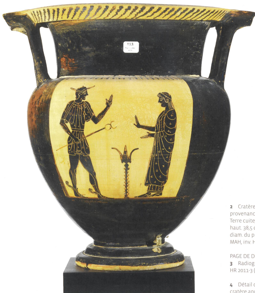
2 Cratère à colonnettes apulien, provenance inconnue, 475-450 av. J.-C. Terre cuite, décor à figures noires, haut. 38,5 cm, diam. de l'embouchure 32 cm, diam. du pied 17 cm. MAH, inv. HR 2011-3.

Cette œuvre a véhiculé – de tout temps – l'image d'un pharaon. Les pieds, chaussés, écrasent en effet neuf arcs, symbolisant les adversaires de l'Égypte, et les maigres reliefs de l'inscription qui parcourait le pilier dorsal se terminent par