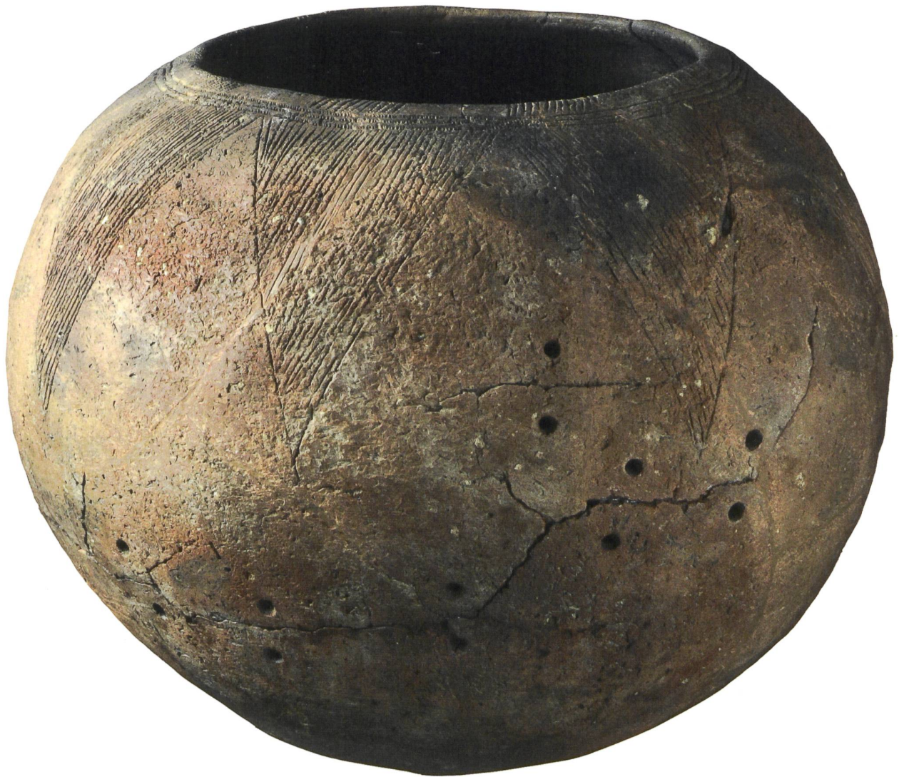
7 Pot sphérique, Kerma, nécropole orientale (fouilles de la Mission archéologique de l'Université de Genève au Soudan), Kerma moyen (vers 2000-1750 av. J.-C.). Terre cuite, diam. panse env. 36 cm. MAH, inv. 27786.