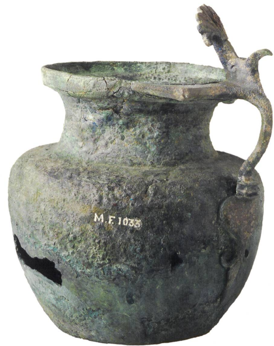
10 Vase restauré durant l'Antiquité, découvert en Italie (?), env. 75 apr. J.-C. (corps du vase); 21 av. J.-C. – 79 apr. J.-C. (anse). Bronze, corps du vase de type d'Arcisate, anse avec appliques végétales de type pompéien, haut. 17 cm. MAH, inv. MF 1033, don Walther Fol 1871.

Suivant un procédé semblable, la vasque d'une patère grecque à manche léontomorphe, découverte à Métaponte en Italie du Sud et entrée dans les collections du Musée d'art et d'histoire en 1971, porte elle aussi la trace d'une réparation antique (fig. 9). La partie arrondie de la paroi du côté du manche a été renforcée à l'intérieur par une plaque de bronze rectangulaire, fixée par 22 rivets en saillie sur l'extérieur,