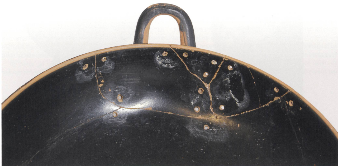
5 Coupe attique à figures noires, découverte à Orvieto (1922), 520-510 av. J.-C. Terre cuite, décor à figures noires, haut. 8,4 cm, diam. 20,8 cm, diam. avec anses 27,3 cm. MAH, inv. 8724.