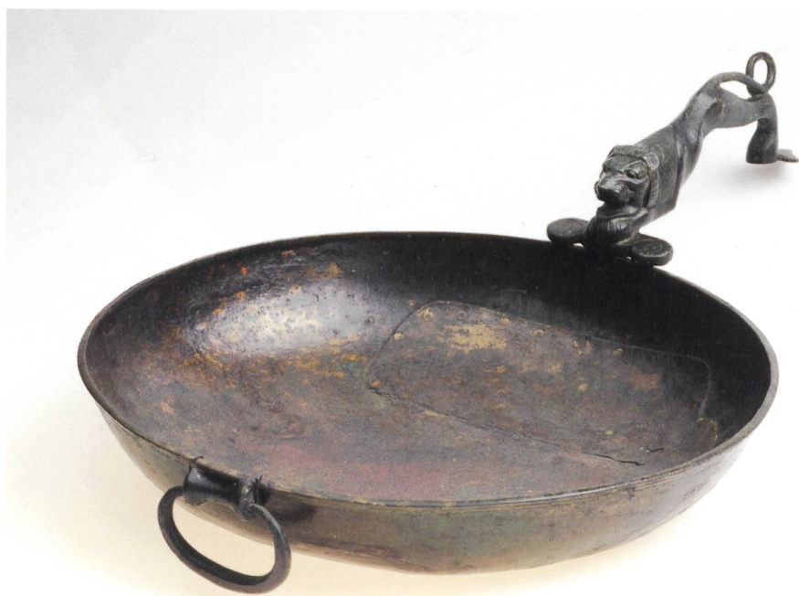
9 Patère en bronze à manche en forme de lion bondissant, découverte à Métaponte (Monte Castro, Pouilles), Attique (?), vers 500 av. J.-C. Bronze martelé (vasque) et moulé (anse mobile et manche), long. totale 48 cm. MAH, inv. 20907.