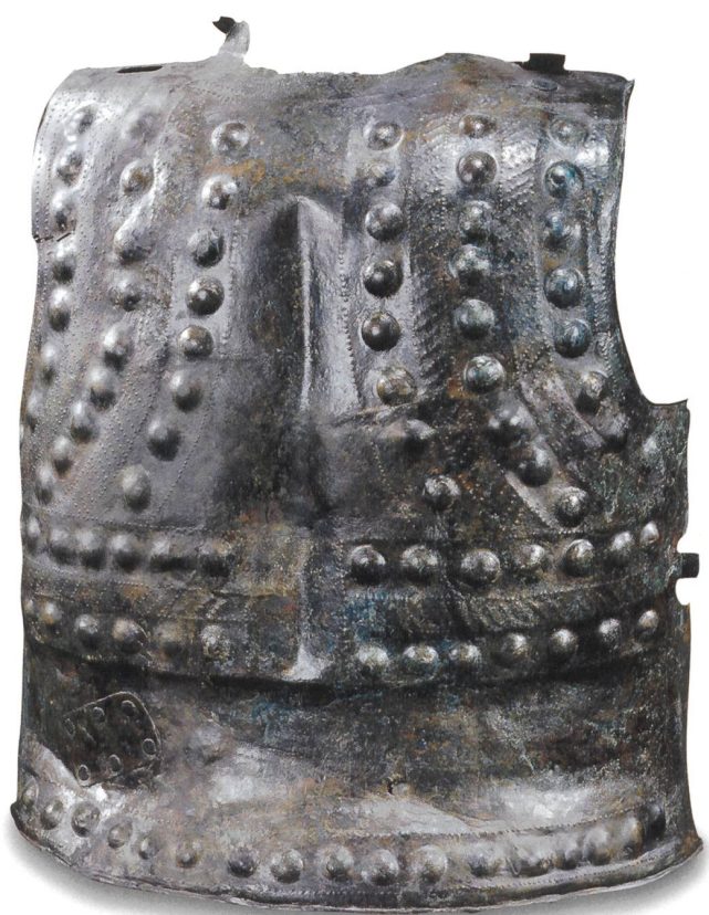
8 Dossière de cuirasse, découverte à Fillinges (Haute-Savoie), Italie du Nord (?), VIII e s. av. J.-C. Tôle de bronze martelée et décorée au repoussé, haut. 49,9 cm. MAH, inv. 14057.