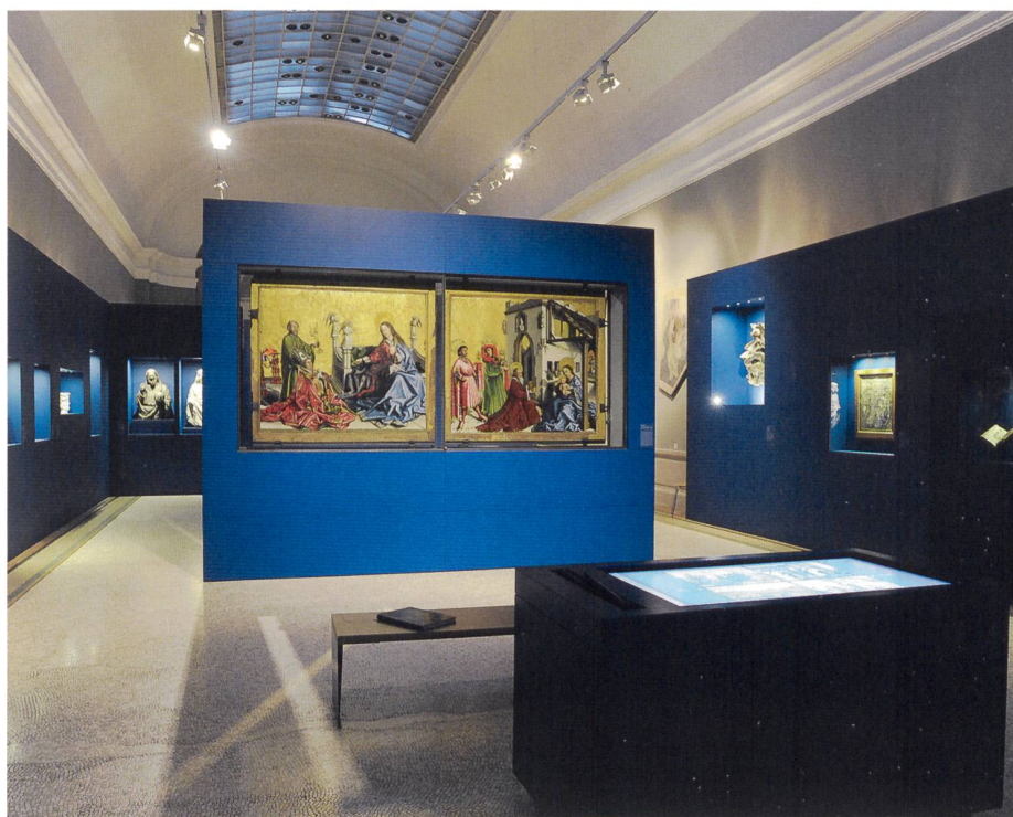
6 La table tactile se trouve à proximité immédiate de l'œuvre originale.

Au moment où cet article est écrit, la table tactile est en place, non loin du retable, depuis plus d'une année. Sa réception a été extrêmement positive, aussi bien auprès des visiteurs que des professionnels. Un argument supplémentaire pour poursuivre sur la voie de la valorisation des multiples activités de nos collègues dans les coulisses de l'institution, qui mettent en évidence l'un des autres rôles primordiaux du musée, celui de gardien des savoirs. |