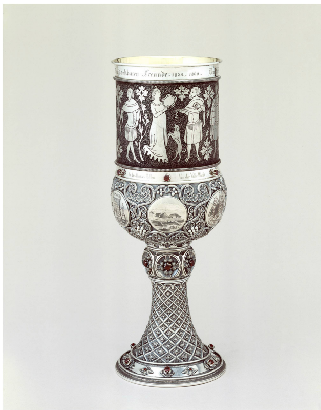
3 Coupe aux armes de Ferdinand Keller, Heinrich II. Fries, Zurich, 1860. Argent, haut. 36,7 cm, poids 1123,4 g. Musée national suisse, Zurich, inv. DEP-3533.

en 1860 pour son soixantième anniversaire, laisse deviner l'inclination particulière que le savant avait pour cette tenture (fig. 3) 35 . On sait qu'au cours du XIX e siècle, plusieurs fragments d'un même textile pouvaient être dispersés sur le marché de l'art 36 . Mais, puisque l'on perçoit pour trois institutions (Genève, Lausanne et Zurich) des liens possibles avec Keller, on se demande si l'archéologue n'a pas possédé lui-même ces fragments, avant de les proposer à ses connaissances 37 . Quant à l'origine de la tenture de Sion, Keller émet l'hypothèse qu'elle proviendrait du palais épiscopal de Sion, mais, à notre connaissance, aucune source ne l'atteste, ni ne documente l'œuvre avant le XIX e siècle.