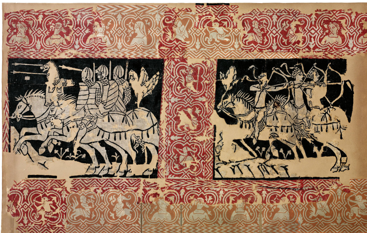
9 Toile de Sion, fragments conservés à Zurich, ayant appartenu à la Société des antiquaires de Zurich. Haut. 46,5 cm, larg. 73,9 cm. Musée national suisse, Zurich, inv. AG-2380.

un cycle narratif ne présente pas deux fois le même épisode, la présence d'une autre tenture au moins, réalisée avec les mêmes planches que la toile de Bâle, se confirme.