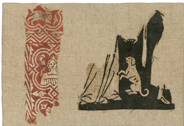
8 Toile de Sion, fragments conservés à Lausanne, ayant fait partie des collections du Musée industriel. Haut 19,2 cm, larg. 6,8 cm (bande verticale) et haut. 16,2, larg. 15,4 cm (robe et chien). Musée historique de Lausanne, inv. AA.325.musée industriel.

Comme ceux de Genève, les fragments de Lausanne étaient collés sur un carton ; ils ont été conditionnés en 2012. Une des deux pièces représente le bas de la robe d'une femme, un petit chien assis sur ses pattes arrière et un des pieds d'un danseur (fig. 8) 26 . Le couple genevois (fig. 1), dont la femme est vêtue