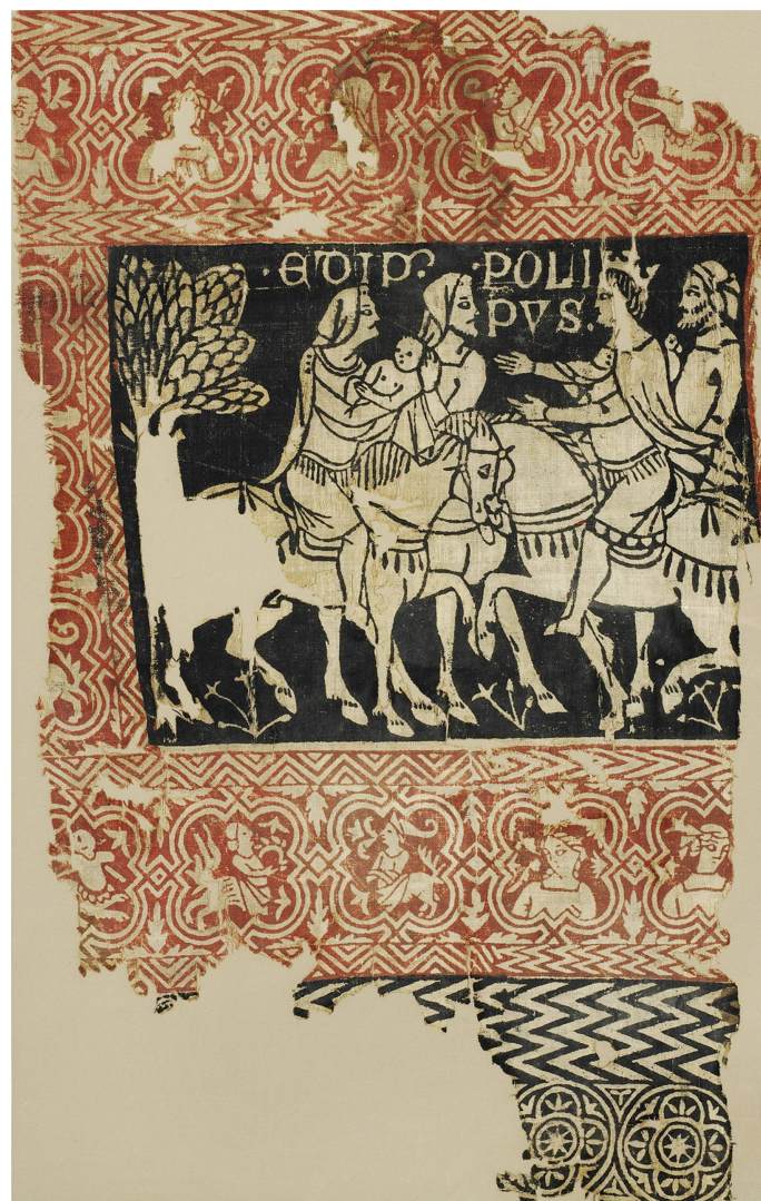
10 Toile de Sion, fragment conservé à Berne, ayant appartenu à la Municipalité de Berne. Haut. 58 cm, larg. 36 cm. Musée d'Histoire, Berne, inv. 701.

Ces toiles s'apparentent beaucoup aux peintures murales qui, au cours du XIV e siècle, ornent de plus en plus les parois des châteaux forts et des palais de scènes courtoises et chevaleresques. On y retrouve la présence d'un cycle narratif et la même palette, restreinte à quelques couleurs seulement. Les textiles d'ameublement, facilement transportables, sont très appréciés par les seigneurs et leur famille qui mènent une vie itinérante entre leurs différentes possessions 31 . Ces deux tentures devaient être suspendues au mur d'une pièce, de réception probablement. Pour couvrir plusieurs parois, comme le voulait l'usage, elles étaient peut-être placées l'une en face de l'autre. Bien que jusqu'à présent aucune source ne l'assure, il est néanmoins plausible que, comme le propose Keller, l'évêque de Sion ait paré son palais de ces