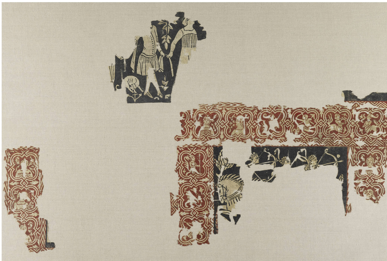
6 Restitution des fragments de Genève après traitement en 2017.