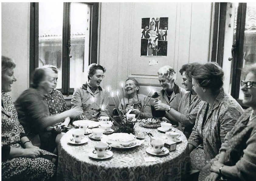
8 L'équipe du vestiaire du Centre social protestant en réunion conviviale dans la tourelle de la Maison Tavel, vers 1965 (?).