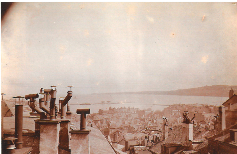
7 Vue sur la rade prise du haut de la tourelle de la Maison Tavel, vers 1900. Archives famille Audéoud.