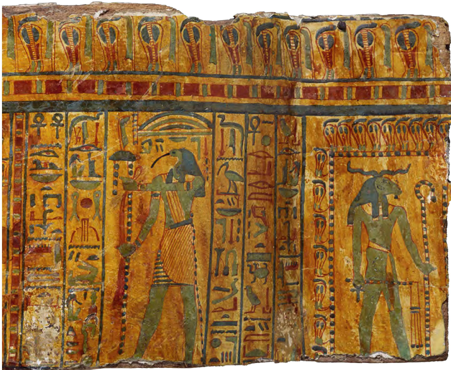
3 Divinité à tête de bélier dans un naos et Thot dans son rôle de pilier du ciel. Détail de la fig. 2.

Au niveau de l'épaule est figuré Thot à tête d'ibis, vêtu d'un pagne plissé jaune à rehauts rouges et verts auquel est suspendue une queue cérémonielle. Une bretelle jaune barre sa poitrine. Cette figure est surmontée d'un toit bombé (chapelle) sans que les parois de l'édifice ne soient indiquées. Le dieu porte collier, bracelets et armilles; il est coiffé d'une perruque tripartite noire. Dans son rôle de pilier du ciel, il tient le signe de l'Occident et un ruban rouge. On lit au-dessus de lui: «Thot, maître des paroles divines». Derrière lui, trois colonnes d'hiéroglyphes, extraits du chapitre CLXI du Livre des Morts : «Paroles à prononcer par Thot, maître des paroles divines, scribe de Maât, à l'Énéade [= compagnie divine]. (col. 2) 'Que vive Rê, que meure la tortue! Indemne est celui qui repose dans <ce> sarcophage. (col. 3) Indemne est l'Osiris [= désignation traditionnelle des défunts], maîtresse de maison, chanteuse d'Amon Tanet<nakht> (?)' ». Devant le dieu, orientées pour lui faire face, deux colonnes d'hiéroglyphes: «Paroles à prononcer par Osiris, maître de l'éternité, qui préside à l'Occident», Ounnefer, gouverneur des deux terres, ...; (2) 'Que vive la vie (?) 30 de l'Osiris maîtresse de maison, chanteuse d'Amon Tanetnakht (?), juste de voix' ».