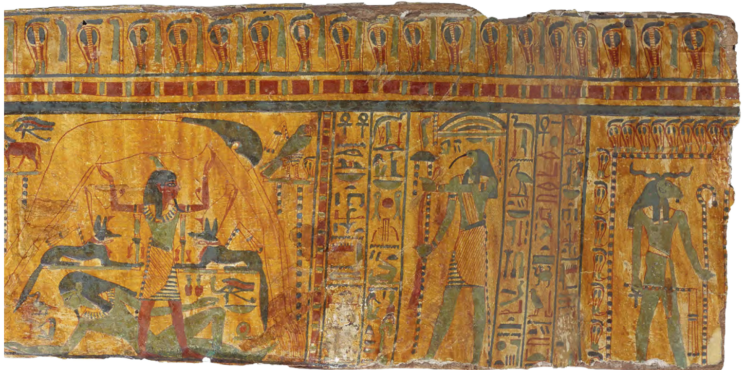
2 Fragment de cercueil. Thèbes (?), Troisième Période intermédiaire, XXI e dynastie, X e s. av. J.-C. Bois polychrome, long. max. 109 cm, haut. 24 / 26,5 cm, ép. 4,5 / 5,5 cm. MAH, inv. A 2016-14; legs Jacqueline Porret-Forel; anc. coll. François Tronchin (?).

comprend un signe horizontal allongé rouge, sans doute un bras (armé?). Une lecture Tanetnakht (?) (= celle-du-victorieux (?)) peut être envisagée 1 . Entre ce qui est interprété comme un bras et l'épithète « juste de voix » (écrite par l'héroglyphe des trois fleurs) qui qualifie la défunte et souhaite son triomphe devant le tribunal d'Osiris, il y a un espace d'environ un cadratin et demi qui peut correspondre à la notation de compléments phonétiques et d'un déterminatif, mais qui pourrait aussi convenir pour un élément supplémentaire de l'anthroponyme ( Ta-net-nakht... ).