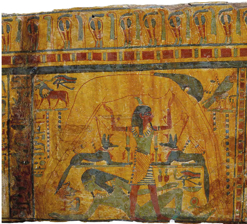
4 Représentation du cosmos. Détail de la fig. 2.