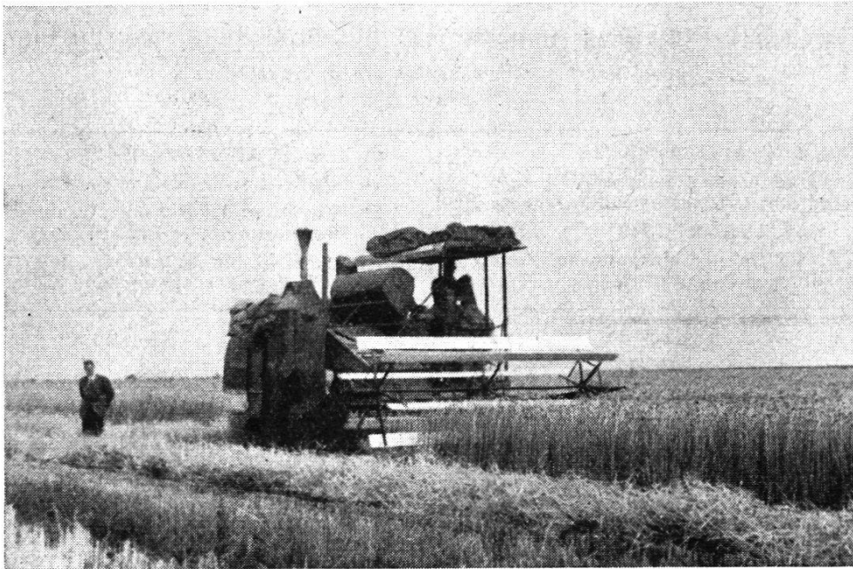
Getreideernte im Nordostpolder 1946

Mit Kriegsausbruch verfügte die Regierung den Höherstau der Zuidersee, wodurch im Süden derselben weite Gebiete unter Wasser zu liegen kamen. Hinter der dadurch gebildeten Wasserlinie hoffte Holland vor feindlichen Angriffen bewahrt zu bleiben. Solche vorbereitete Unterwassersetzungen schaden im allgemeinen nicht viel, da die Wassertiefe nur 10–20 cm beträgt. Die sehr starken Festungen zu beiden Seiten des Abschlußdeiches wurden bemannt und im Verlaufe der kurzen Kriegshandlungen einige Aufzugsketten für die Schützen gesprengt, sowie Brücken leicht beschädigt. Nach der Kapitulation war alles wieder sehr rasch hergestellt, da genügend Material verfügbar war.