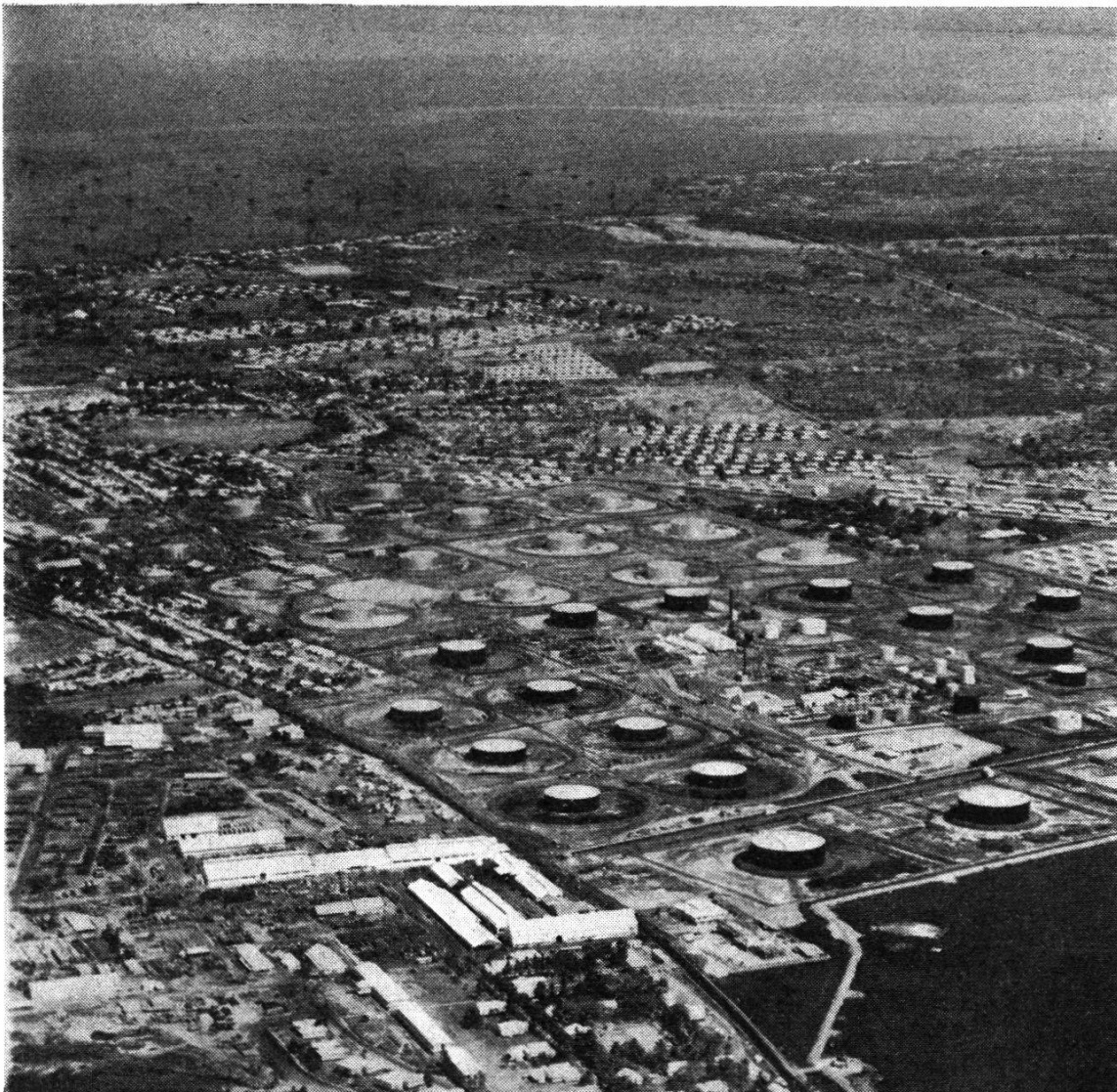
Abbildung 15. Teilansicht eines Ölfeldes

Umgekehrt wird, wenn die Versuchsbohrungen mit Erfolg gekrönt sind, in Gegenden, die früher nicht oder kaum bewohnt waren, eine derartige Tätigkeit einsetzen, daß man Mühe hat, schon nach kurzer Zeit die frühere Wildnis wieder zu erkennen. Der Urwald wird gerodet, Sümpfe werden entwässert, und über alles zieht sich ein dichtes Straßennetz, das jeden Punkt im Felde mit Lastwagen und Auto zugänglich macht. Die Wohnkolonien des Personals und der Arbeiter sind gewachsen und werden vielleicht schon einige hundert Häuser zählen und trotzdem wird eine chronische Wohnungsnot vorherrschen, die allen in Entwicklung sich befindenden Ölfeldern eigen ist. Denn nachdem die erste Pionierarbeit getan ist, werden auch Familien mit Kindern ins Feld einziehen, Schulen,