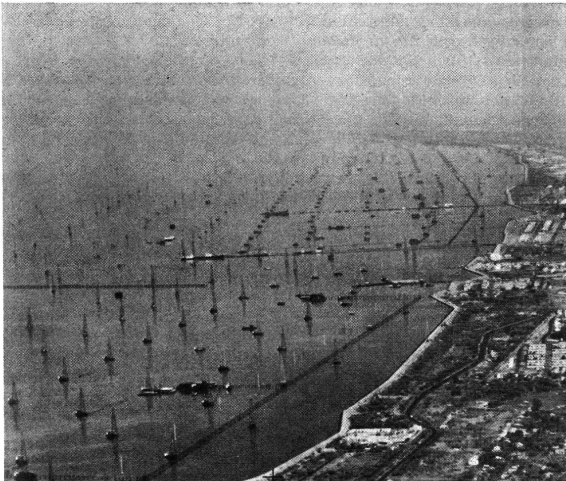
Abbildung 16. Seebohrungen an der Ostküste des Maracaibo-Sees

Die Lage der Bohrungen wird durch einen sogenannten Lokationsplan festgelegt, aus dem die Koordinaten jeder zukünftigen Bohrung entnommen werden können. Diese Bohrlokationen werden in einem Netz von gleichseitigen Dreiecken angeordnet, so daß die Abstände zwischen den Bohrungen überall gleich sind. Man unterscheidet kurzabständige (short spaced) und weitabständige (wide spaced) Bohrsysteme, d.h. Bohrabstände von 200 Meter und 400 Meter. Die Porösität der Ölsande sowie die Eigenschaft des Öles selbst wird entscheiden, welches der beiden Systeme zur Anwendung kommt. Das Straßennetz eines Feldes ist den Bohrlagen angepaßt, ebenso die Produktionsstationen, wo das Öl von zehn oder mehr Bohrungen von einer lokalen Tankstation aufgenommen und nach einer zentralen Großtankstelle gepumpt wird. Von hier erfolgt die Verladung auf Tankschiffe oder, wenn das Feld im Inneren des Landes liegt, der Transport durch lange Röhrenleitungen (pipelines) nach der Küste. Solche Leitungen führen das Öl manchmal über enorme Distanzen, was zur Anlage von leistungsfähigen Pumpstationen zwingt, die, je