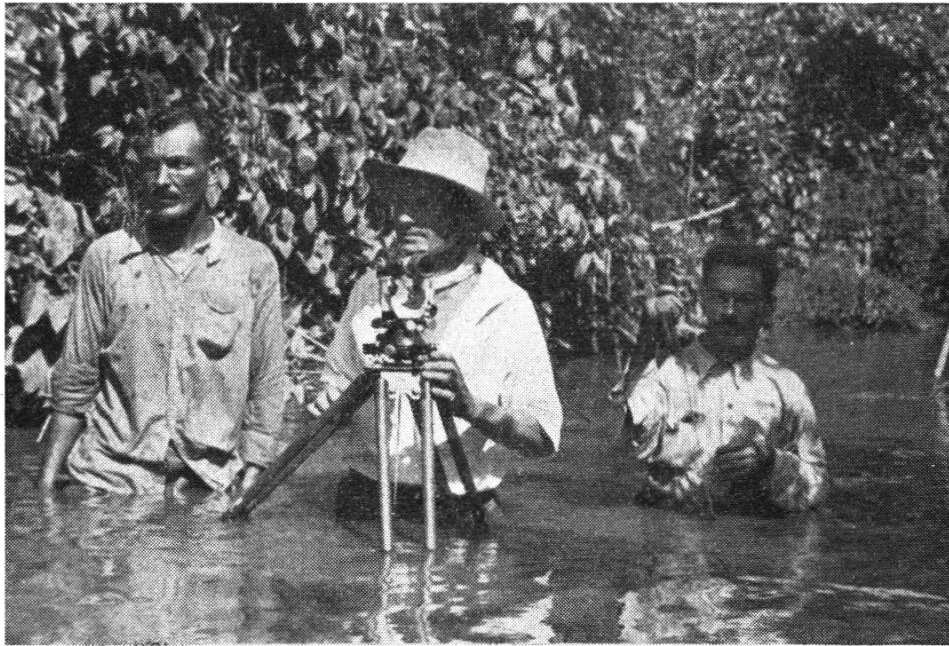
Abbildung 14. Aufnahmen für Entwässerungsprojekte

lich in der großen Übersichtlichkeit der Zugangsmöglichkeiten, die ein Abwägen der Vor- und Nachteile von verschiedenen Varianten ohne zeitraubende Feldrekognoszierung gestattet, was besonders im Urwaldgebiet von unschätzbarem Wert ist. Ist einmal das Tracé im Bilde festgelegt, so kann die Absteckung desselben mit Hilfe von identifizierbaren Punkten im Feld vorgenommen werden. Wenn dabei auch da und dort noch kleine Abänderungen der Straßenaxe notwendig erscheinen, so kann man doch mit guter Sicherheit annehmen, daß man auf der ganzen Länge des Projektes keinen unvorhergesehenen Hindernissen begegnen wird, die unter