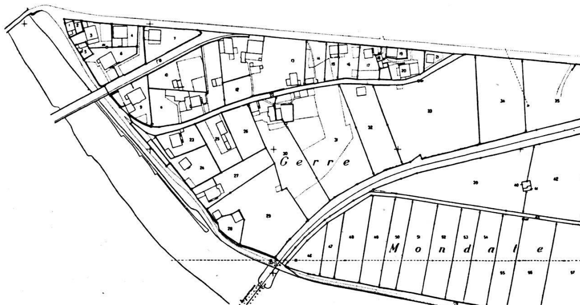
Fig. 5. Partie d'un plan original

On lut ensuite, à l'autographe, les coordonnées des mêmes points-limites, puis on les transforma en coordonnées géographiques compensées Y_a, X_a .