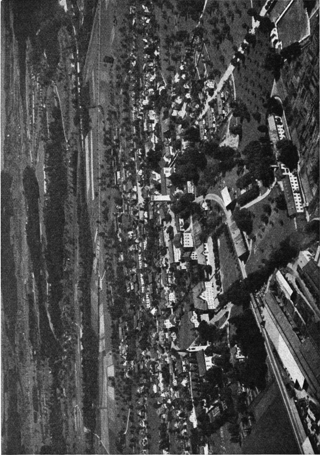
Abb. 2. Fliegerbild Niederuzwil von Süden