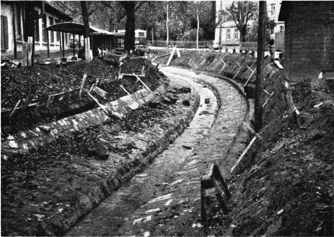
Der korrigierte Stadtbach im Oberlauf mit gepflasterter Niederwasserrinne und beidseitigen Bermen. Weitgehend ist noch der alte Uferschutz ersichtlich.

bauten, Weganlagen, der Güterzusammenlegung, Windschutzpflanzungen, Wildbachverbauungen und der Besiedlung mit neuen Bauernhöfen, Trattstallungen und Feldscheunen. Im Laufe von fünfzehn Jahren hat sich das Landschaftsbild im Talboden zwischen Au und Oberriet vollständig geändert, und die fleißige Rheintaler Bauersame hat eifrig mitgeholfen, die durch die Neuzuteilung erhaltenen Grundstücke noch weiter zu verbessern und intensiv zu bewirtschaften.