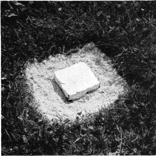
Abb. 1. Signalisierter Markstein