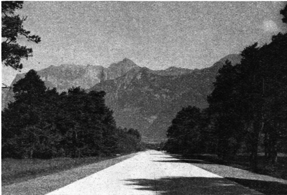
Autostraße Zizers–Landquart, gebaut 1956–1958

Es war dem Kanton Graubünden denn auch nur möglich, seine Straßenausbauprogramme zu finanzieren, nachdem der Bund sich bereitfand, aus dem Überzoll auf die Treibstoffe, deren Erhebung im übrigen nur als Verkehrsgebühr begründet werden kann – dem sogenannten Benzinzollviertel –, den Kantonen als Beitrag an die Kosten des Straßenausbaues und -unterhalts abzugeben.