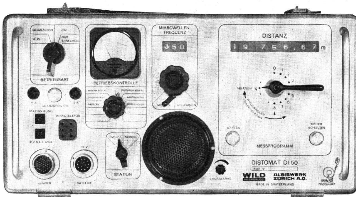
Abb. 3. Bedienungsgerät

Die innere Genauigkeit des Gerätes ist besser als \pm (2 \text{ cm} + D \cdot 10^{-6}) . Für die praktische Messung mit allen derartigen Geräten muß noch die Unsicherheit berücksichtigt werden, die bei der Bestimmung der atmosphärischen Daten (Brechungsindex) entsteht. Dazu kommt noch ein etwaiger verfälschender Einfluß infolge Bodenreflexionen, so daß schließlich mit einer praktischen Meßgenauigkeit von \pm (2 \text{ cm} + D \cdot 10^{-6} \dots D \cdot 10^{-5}) , je nach Verhältnissen, gerechnet werden kann. Als Lichtgeschwindigkeit wird der Wert 299\,792,5 \pm 0,4 km/s benützt, der von