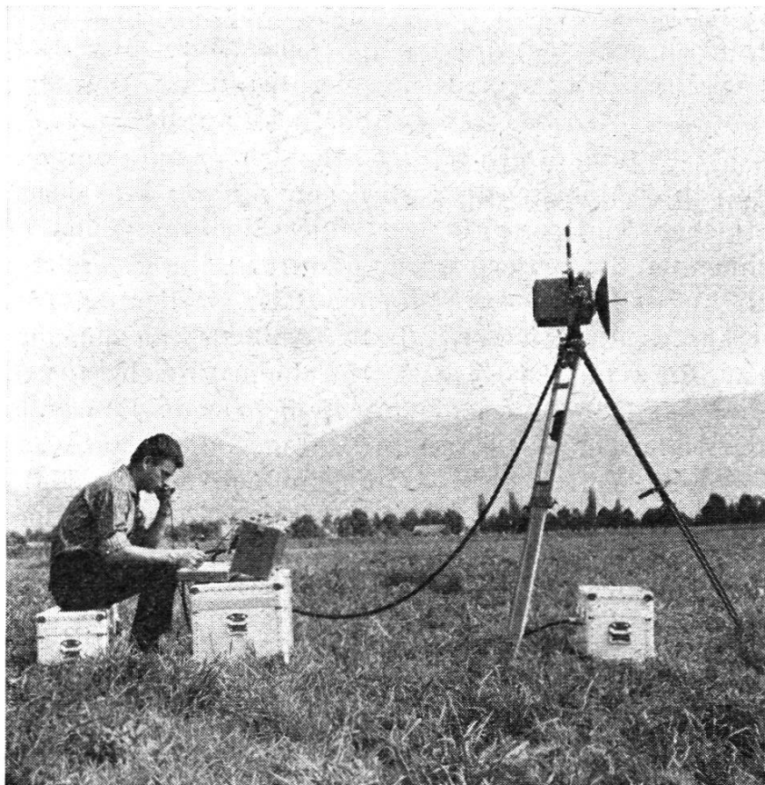
Abb. 1. Distomat Wild DI 50 betriebsbereit aufgestellt

Es ist tragbar und sehr einfach in der Bedienung; zudem ist auf der Innenseite des Deckels eine Kurzbedienungsanleitung angebracht. Je am Endpunkt der zu messenden Strecke wird eine Distomat-Station, bestehend aus Sender, Bedienungsgerät, Batterie und Stativ, aufgestellt. Beide Stationen sind identisch und austauschbar; ihre Funktion ist aber verschieden. Mit einem Schalter kann eingestellt werden, ob eine Station als Haupt- oder Nebenstation arbeitet. Der Sender mit der Antenne paßt in einen Wild-Dreifuß T2 mit optischem Lot, der normalerweise auf ein Wild-Stativ aufgesetzt wird. Diese wird wie mit einem Instrument über dem Bodenpunkt aufgestellt. Für Pfeilermessungen steht eine entsprechende Grundplatte zur Verfügung. Der Sender ist auf einfachste Weise gegen einen Wild-Theodoliten austauschbar (Zwangszentrierung). Der Nullpunkt des Gerätes liegt in der Kippachse und be-