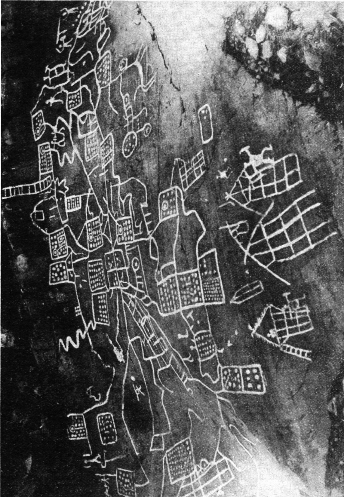
Ortsplan aus der Bronzezeit, um die Mitte des 2. Jahrtausends vor Christus. Felszeichnung bei Capo di Ponte, Val Camonica (Ansicht)