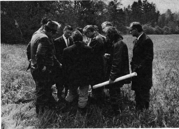
Verhandlungen im Gelände

Die Interessenabwägung der verschiedenen beteiligten Interessen kann nicht nur am Zeichen- und Konferenztisch geschehen. Der Bundesbeschluss zum Reusstalgesetz von 1971 verlangt die Mitwirkung eines Fachmanns der Landschaftspflege bei der zweiten Reusstalmelioration.