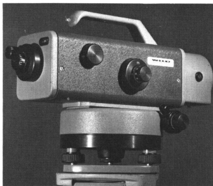
Abb. 1 Das neue Präzisionsnivellier WILD N3

Für den Geodäten liegt der Vorteil dieser Kippschraube darin, dass zum Beispiel beim Flussübergangsnivellement die Ablesungen der Visuren zu den Zieltafeln als Messung kleiner Neigungen mit der Kippschraube ausgeführt werden können.