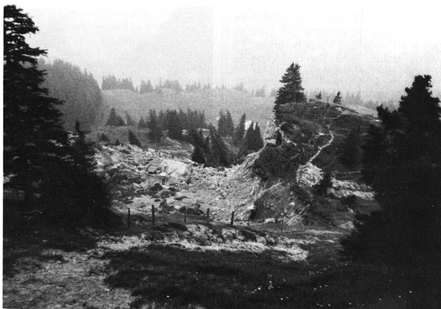
Abb.5 Der Anriss von oben gesehen. Links der Rutsch, von rechts ragt das Ende des abgerutschten Nackentälchens ins Bild. Der Beginn eines Entwässerungskanales ist ebenfalls zu sehen. Oben hinten in der Bildmitte das Alpgebäude von Unterschwarzenberg.

Die folgende Aufzählung soll nur summarisch erfolgen. Bereits am 22.Juni wurden die Algebäude Unterschwarzenberg und Spittel evakuiert. Auf Unterschwarzenberg baute das Militär später an sicherer Stelle eine Notunterkunft und Notstallung. Am 23.Juni bildete der Gemeindepräsident von Flühli einen Krisenstab um sich, der am 25.Juni durch den kantonalen Krisenstab abgelöst wurde, welchem auch der Kommandant der Territorialzone II angehörte. Dieses Gremium wurde am 2.Juli wieder ersetzt durch den Not-