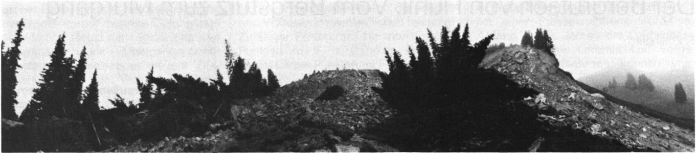
Abb. 2 Blick von ca. 1480 m gegen das Anrissgebiet hinauf. Der eigentliche Anriss ist nur zum Teil ganz oben hinter den in der Bildmitte nach rechts gekippten Tannen zu sehen. Links im Bild der Beginn des zum Stillstand gekommenen Rutschteiles Richtung Unterschwarzenberg. Rechts oben der abgerutschte Teil der Krete, welche ihre Fortsetzung früher zum linken Bildrand hin hatte.

frei zu halten. Am 24. Juni wird die Situation dann aber sehr kritisch, weil Blöcke und Baumstämme den Fluss an der Brücke immer wieder völlig stauen. Damit wird das Rorigmoos bedroht, und auch die Kantonsstrasse Schüpfheim-Flühli (Sörenberg) steht zeitweise unter Wasser und Schlamm. Man plant nun einen Entlastungskanal, der die Schuttmassen direkt unterhalb der Rorigmoosbrücke in die Waldemme führen soll. Der 150m lange, bis 17m breite und 3m tiefe Kanal kann aber erst mit dem Einverständnis der Transitgas AG ausgehoben werden, denn die Erdgasleitung Genua-Ingoldstadt führt an dieser Stelle durch. Nachdem der Druck in der Pipeline (83cm Durchmesser) von 70 auf 50 bar reduziert worden ist, gibt der eidgenössische Rohrleitungsinspektor die Bewilligung zum Bau des Kanals.