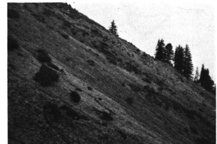
Abb. 4 Die Gleitfläche im obersten Anrissgebiet weist eine Neigung von 30 Grad auf und ist von nachrutschendem Feinmaterial, Boden und Rasenziegeln bedeckt, so dass man nicht erkennt, dass es sich um Nagelfluh handelt.

Das durch Humus und Boden sickernde Wasser geht im Untergrund dem kleinsten Widerstand nach. Es fliesst deshalb oft entlang den schräg gestellten Gesteinsschichten, insbesondere dann, wenn die untenliegende Schicht undurchlässiger als die obere ist. In besonderen Fällen wie beim Bergrutsch von Flühli kann dadurch eine Gleitschicht entstehen. Als Folge davon ist