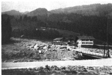
Abb. 3 Im Vordergrund die Kantonsstrasse, dahinter fliesst von links nach rechts die Waldemme (nur linkes Ufer sichtbar), weiter hinten der Schuttkegel von Hellschwandbach und Berggrutschmaterial und Häuser von Rorigmoos. Rechts im Bild die Rorigmoosbrücke. Zwischen ihr und dem weissen Haus führt der Entlastungskanal von links nach rechts (nicht sichtbar, im Gegensatz zum darüber führenden Notsteg in der Bildmitte).

Der Entlastungskanal löst die Verklauungsprobleme in der Waldemme recht befriedigend, doch er unterbricht die Fortsetzungsstrasse der Brücke im Westen, d.h. die Verbindung ans linke Flussufer. In der Folge müssen 20 Gehöfte mit 80–100 Personen und 250 Tieren mit Helikopter und über einen schmalen Notsteg versorgt werden. Die