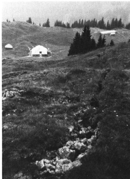
Abb. 7 Blick vom zum Stillstand gekommenen Teil des Berggrutsches hinunter auf die Alp Unterschwarzenberg: Links das alte, gefährdete Alpgebäude, rechts hinten die Notgebäude. Im Vordergrund sieht man einen der vielen Zugrisse im Boden.

8 Hektaren Weiden sind unbrauchbar geworden, 500–800m 3 Holz liegen zerkleinert im Schutt, das Gerinne des früher harmlosen Hellschwandbaches ist heute zum Teil 3–4m tief und 10–25m breit eingefressen, Alpstrassen und Versorgungsleitungen sind zerstört. Wer bezahlt diese Schäden in der flächenmässig grössten und doch eher armen Gemeinde des Kantons Luzern? Für Gebäudeschäden kommt die kantonale Gebäudeversicherung auf, für jene am Kulturland die Schweizerische Hagelversicherungsgesellschaft, falls das