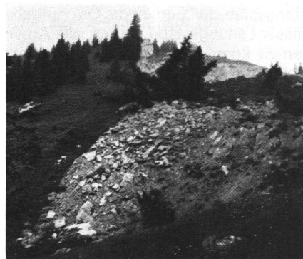
Abb.6 Durch den starken unterirdischen Druck wurde dieses Gestein aus dem Hang gequetscht und es entstand diese «Platzwunde» im Hang gegen Unterschwarzenberg. Oben in der Mitte der Anriss, der sich bis zum rechten Bildrand hinzieht. Das noch intakte Nackentälchen liegt am linken Horizont.

Die hangparallele Anrissstelle ist 100–150 m lang. Von dort rutschte die Hauptmasse gegen Nordosten, z.T. über die erwähnte Krete in den Spittelgraben. Eine zweite Masse blieb südlich der Krete, rutschte und sackte bis zu 20m gegen Unterschwarzenberg. Dabei entstanden auf der einen Seite «Platzwunden» (Abb.6) an Stellen grossen Druckes und auf der anderen Seite tiefe Zugrisse im Boden. Viele einzelne Geländeteile schienen sich dabei relativ unabhängig voneinander bewegt zu haben, so dass man in diesem Gebiet Rutsch-, Druck-, Zug- und Fliesszonen dicht beieinander findet. Geomorphologisch ist dieser Teil des Berggrutsches noch heute sehr interessant, obschon