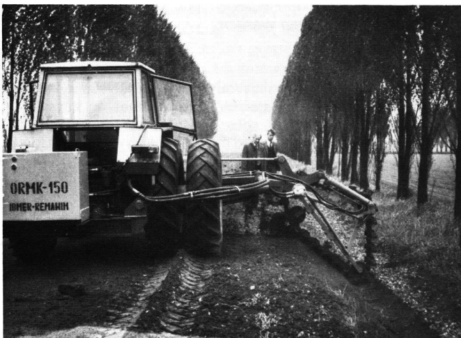
Abb. 2 Grabenreiner bei der Arbeit

Für unterhaltspflichtige Landwirtschaftsbetriebe und -genossenschaften fällt zudem eine einfache Montage- und