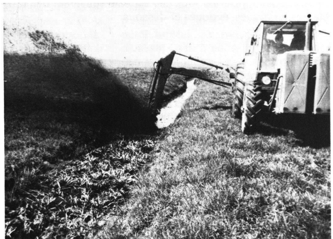
Abb. 3 Sohlenreiner mit Rotor bei der Grabenreinigung