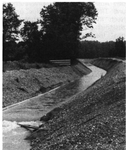
Abb.1 Reusskanal im alten Zustand und ausgebaut bei demselben Hochwasserereignis. Das rechte Bild wurde ca. 3 km kanalabwärts vom Aufnahmestandort des linken Bildes aufgenommen.