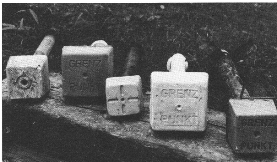
Abb.2 Sortiment der im Kanton Thurgau verwendeten Marken, von links nach rechts: Frings, mit Stahlrohrschäft; Klarer, Vollpolyester; Attenberger, Stahlrohr mit Spindel; Klarer; Frings, Vollpolyester