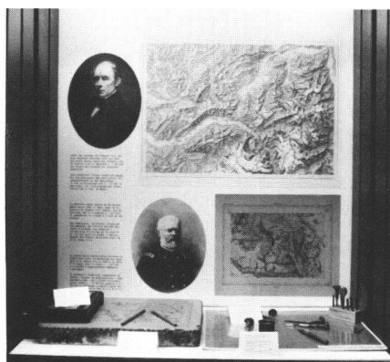
Fig. 5 Vitrine sur les cartes topographiques Dufour et Siegfried.

En espérant offrir aux visiteurs une impression tout de même marquante de la mensuration cadastrale, nous