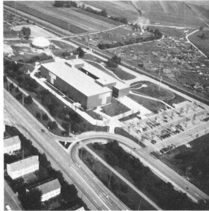
Fig.1 Vue générale des bâtiments du Technorama; au second plan, la coupole du Laboratoire de la Jeunesse.

A l'instigation de plusieurs personnalités de notre profession, notamment de l'ancien directeur de l'Office fédéral de la Topographie, Monsieur E. Huber, une surface de 150 m 2 , située dans le secteur de la physique, fut réservée à la «Mensuration». Fin octobre 1981, une première séance permit de fixer le cadre général de cette exposition, et de créer un groupe de travail avec des représentants de la Direction fédérale des mensurations, de l'Office fédéral de la Topographie, des Ecoles et des firmes Kern et Wild. Il restait 5 mois jusqu'à l'ouverture du Technorama! Il fallait faire vite. En janvier, le projet détaillé était sur pied; à fin mars, nous commençons à livrer et à monter nous-mêmes une grande partie du matériel d'exposition. Le jour de l'inauguration, le 8 mai 1982, notre secteur était l'un des