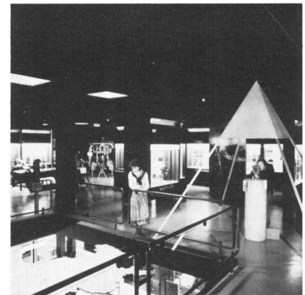
Fig. 2 Vue partielle du secteur Mensuration, avec la Suisse au 1:50 000 et la pyramide de triangulation. On distingue le théodolite, le niveau et l'appareil MED avec lesquels le visiteur peut effectuer de véritables mesures.

Le visiteur parcourera en un rapide survol les grandes étapes de l'étude de la forme de la Terre, depuis l'antiquité jusqu'à nos jours. Des illustrations montrent la vision géocentrique de l'Univers selon Ptolémée, le modèle héliocentrique de Copernic, puis l'âge