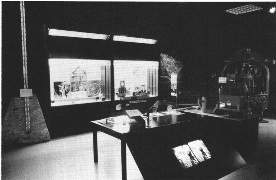
Fig. 8 Vue partielle du secteur Mensuration. On distingue l'autographe Wild A5, les stéréoscopes et les vitrines sur la photogrammétrie. A gauche, un bloc de granit avec une mire de nivellement, sur laquelle le visiteur peut effectuer des mesures.

Wir wünschen Ihnen auf alle Fälle schon jetzt recht viel Vergnügen (und genügend Zeit dazu) in Oberwinterthur.