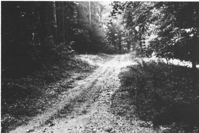
Abb. 1 Auf solchen alten geschotterten Forstwegen (sogenannte Kieswege) wird mit Hilfe eines Dozers ein dem Gelände angepasstes Planum erbaut, auf das Betonbeläge in der notwendigen Breite von 3 Meter und der Stärke von 18 Zentimeter erstellt werden. Weitere Fundationsarbeiten sind nicht notwendig. Auch ist der Antransport des Frischbetons auf diesen alten Wegen ohne Behinderung möglich.

Die Waldböden in der Gegend von Chabrey sind wenig tragfähig. Sie können nicht mit Lastwagen befahren