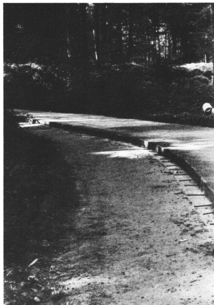
Abb.8 Von der Försterschule Lyss mit einem Fertiger auf einem alten wassergebundenen Schotterweg erstellter Betonweg (Maschineneinbau).

Der Fertiger ermöglicht eine grössere Leistung, was mehr Frischbeton pro Zeiteinheit verlangt, jedoch dadurch eine leistungsfähigere Transportorganisation bedingt. Mindestens zwei Dumper waren notwendig. Die Dumper