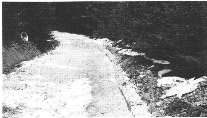
Abb. 2 Bei neuen Wegen im weichen Waldboden ist oft eine Stabilisierung mit Kalk oder Zement von Vorteil. Eingesandte Bodenproben werden vom Labor der Betonstrassen AG in Wildeggen untersucht. Die notwendige Bindemittelmenge pro Quadratmeter wird dort festgestellt. Auf der Baustelle wird das Bindemittel, in Chabrey Kalk (siehe leere Säcke am rechten Bildrand) von Hand ausgestreut und mit Scheibengegen in den Beton eingearbeitet. Anschliessend wird maschinell planiert und mit Walzen verdichtet. Das dem Gelände angepasste Planum ist gleichzeitig Transportpiste.