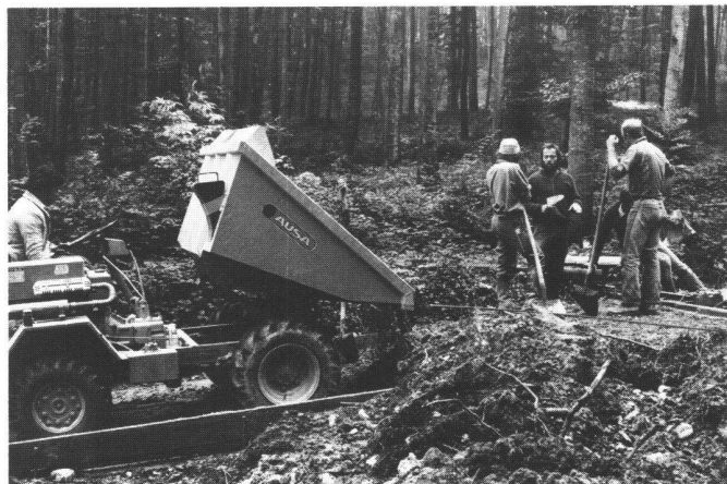
Abb. 4 Der Dumper kippt den Frischbeton vor Kopf, worauf er von Hand mit Schaufeln auf die notwendige Breite verteilt wird.