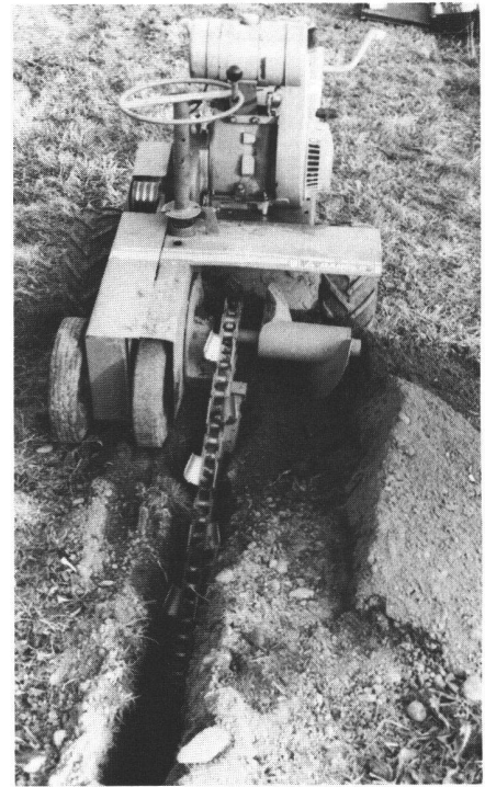
Abb. 6 Handliche Klein-Grabenfräse Ditch-Witch mit 9 PS, einer Arbeitstiefe von bis 50 cm und Grabenbreiten von 8, 16 und evtl. 24 cm.

Wegen, Strassen, Bahndämmen, Gebäuden oder Gewässern kann zu erheblichen Aufwendungen führen. Mit der Vorführung einer Horizontalrammung (Bodendurchschlagsrakete) zeigte die Firma Chestonag, dass dieses Problem bis zu einem Durchmesser von 800 mm und bis zu Längen von über 80 m elegant und recht kostengünstig gelöst werden kann.