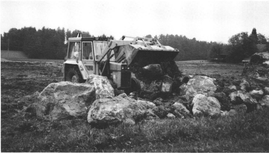
Abb. 7 Sanierung einer alten, nicht gelungenen Rekultivierung in Horgen. Die Steine wurden dem Unterboden entnommen und zeigen einen offensichtlichen Grund des Misserfolges der Rekultivierung.