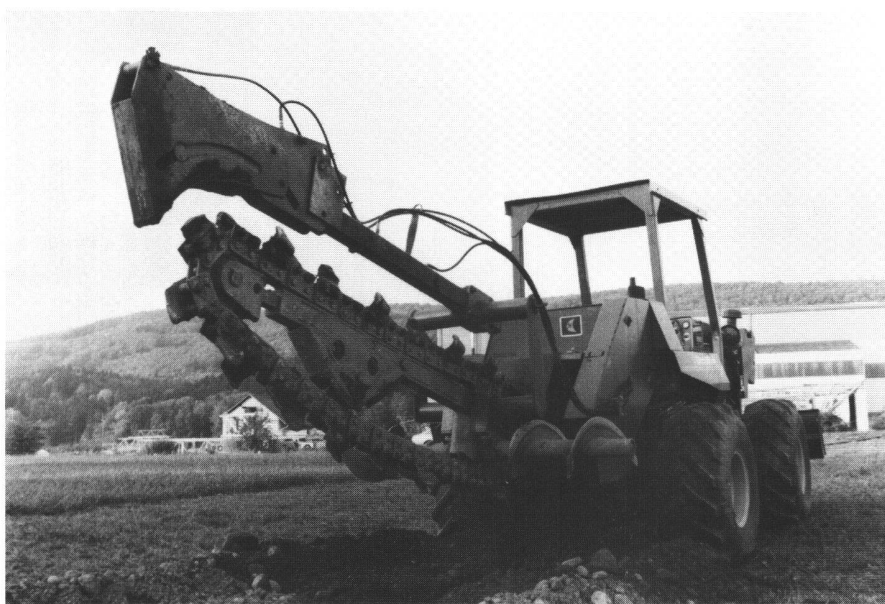
Abb. 5 Grabenfräse Ditch-Witch mit 66 PS, einer Arbeitstiefe bis 210 cm und Grabenbreiten von 16, 25, 32, 40 und 60 cm.