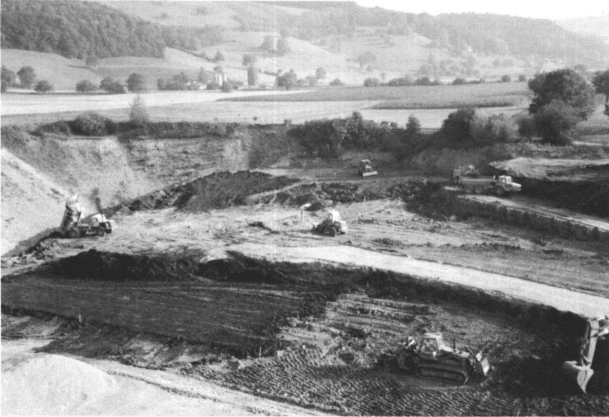
Abb. 7 Reaktivierungsarbeiten Degerfeld der Firma S. Amsler in Schinznach-Dorf. Praktisch gleichzeitig wurden Teile der Rohdeponie (hinten) und des Unterbodens (Mitte) geschüttet, während das Tieflockerungsgerät (vorne rechts) im Betrieb war und bereits der Humus aufgetragen wurde (vorne links).

eigentlichen Reaktivierungsarbeiten machte man einige Vereinfachungen – sprich: Einsparungen – im Vergleich zum auf Sicherheit angelegten Standardablauf. Auch wenn die Reaktivierung ein Jahr nach Vollendung als absolut gelungen bezeichnet werden darf, wird sich doch erst in späterer Zeit zeigen, ob sich die gemachten Vereinfachungen rechtfertigen liessen, denn der Erfolg von Reaktivierungen darf erst nach einigen Jahren beurteilt werden.