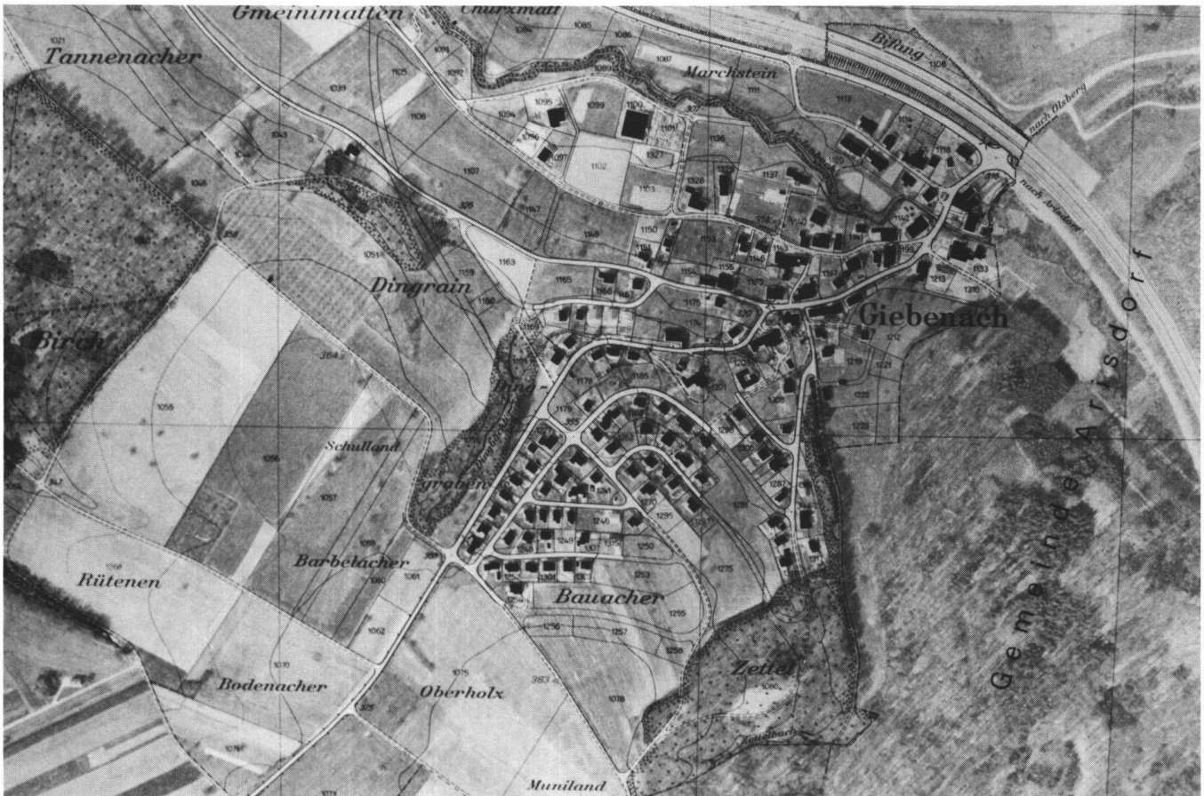
Abb. 3 Kombination Orthophotoplan/Übersichtsplan 1 : 5000 (Ausschnitt)

Bildflug im März/April 1984, Ost-West. Bildmassstab ca. 1 : 10 000, Längsüberdeckung 90%, Querüberdeckung 30% \pm 15%, mittlere Flughöhe über Grund 1530 m, Objektivbrennweite 153 mm. Aerotriangulation von drei gebohrten Punkten in jeder Bildachse der 60%igen Überdeckung für spätere grafische Auswertung im Einzelmodell.