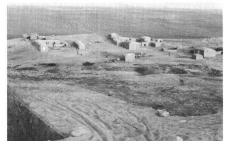
Abb. 3 Das Dorf Hamidi vom Hügel aus gesehen. Im Hintergrund die unendliche Weite der Djezira. Im Vordergrund die ersten beiden Grabungsquadrate.

Die zweite Aufgabe der Vermessung war das Erstellen eines Höhenkurvenplanes. Diese Aufgabe wurde mit einer Methode gelöst, die erst mit Hilfe eines Computers denkbar wurde. Das Gelände wird durch die koordinatenmässige Bestimmung von Detailpunkten digital