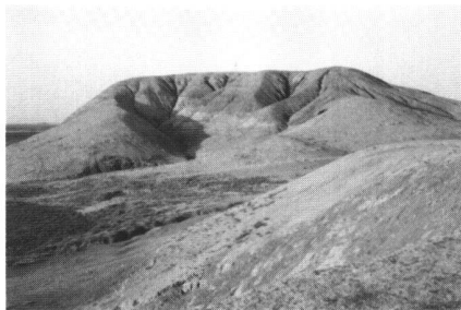
Abb. 2 Hügel aus Südwest. Die Gräben, Wadis genannt, entstanden durch heftige Frühlingsgewitter. Unter der rötlichen Schicht, die den Hügel durchzieht, vermuten die Archäologen Grundmauern einer verfallenen Zitadelle. Auf dem Hügel das Triangulationsgestell.

entfernt. Hamidi ist der Name des kleinen Dörfchens, das am Abhang des Hügels liegt, aus acht Häusern besteht und von drei Familien mit insgesamt etwa 30 Mitgliedern, davon \frac{2}{3} Kindern, bewohnt ist.