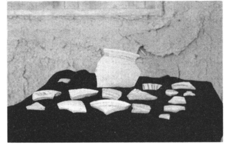
Abb. 4 Erste Grabungsfunde: Scherben aus dem 2. Jahrtausend v. Chr.