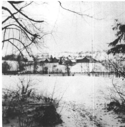
Abb. 1: Das Übungsgebiet: Güterzusammenlegung im Widerstreit sich konkurrierender Interessenten der Landwirtschaft, der Erholung, des Naturschutzes, der Wohnnutzung.

Diese Aufgaben, insbesondere im Agglomerationsgebiet, sind daher zum Thema eines Vertiefungsblocks gewählt unter der Leitung des Instituts für Kulturtechnik, Abteilung Planung und Strukturverbesserung