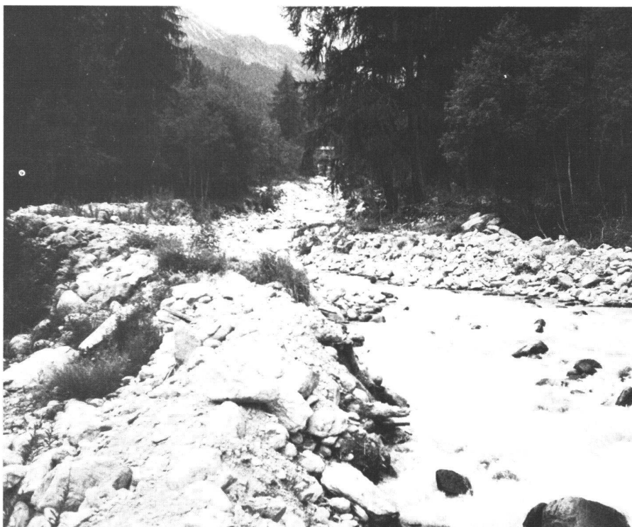
Abb. 6: Flussabschnitt des Rom bei Valchava. Links und rechts im Bild sind provisorische Korrekturarbeiten durch einen Bagger sichtbar.

men berücksichtigt werden müssen. Insbesondere gilt dies in einer Situation, in welcher bestehende Projekte (Bewässerung, Biotopenschutz) durch neue Absichten (Wasserkraftnutzung) konkurrenziert werden. So ist zu erwähnen, dass die sich kurz vor dem Abschluss befindende Gesamtmelioration Fr. 32 Mio kostet und dieses Jahr eine neue Fischzucht bei Müstair in Betrieb genommen wird. Dass dem Tal neue Energiequellen erschlossen werden sollen, bestreitet niemand. Es fragt sich nur, ob mit dem Festhalten am neuen Projekt nicht Werte gefährdet sind, welche zusammen einiges mehr an Kosten und Zeit verbrauchen, als der gesamte Kraftwerksbau.