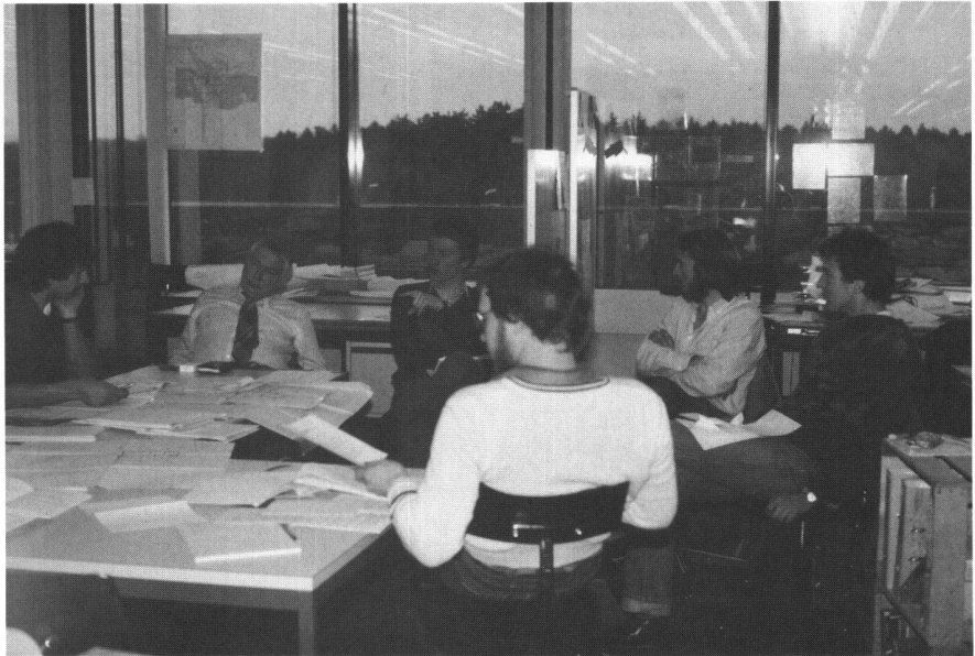
Abb. 2: Die Arbeitsweise: Kolloquium mit Präsentation der Zwischenresultate durch die Studenten und Diskussion mit der Übungsleitung (Bild: M. Aebli).

Durch die Arbeit in einer Übungsgemeinde ergeben sich sehr viele fruchtbare Kontakte mit Praktikern, was aus der Situation des Assistenten sehr zu begrüssen ist. Der Ausbau dieser Kontaktmöglichkeit z.B. durch gemeinsame Veranstaltungen mit der Praxis sollte gefördert werden.