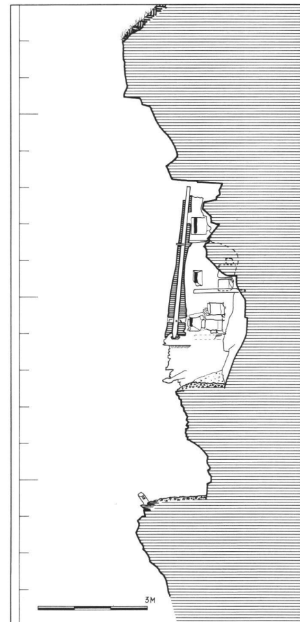
Abb. 5: Hérémente VS, «Grotte aux Fées», Beispiel eines Vertikalschnittes durch den oberen Bau von Abb. 2; mit Holz armierte, gegen den Berg geneigte Mauer; 4 sehr niedrige Abschnitte (Geschosse?), darin Lichtscharten und Wandfächer; unten Zugangsband zum unteren Bau mit Auflager eines ehemaligen Steigbaumes zum Eingang in den oberen Bau.

lich-stolzen Gepräge. Gerade im Wallis hatten Wirtschaftsform und Lebensweise zur Folge, dass zu gewissen Zeiten des Jahres die Hauptsiedlungen praktisch unbewohnt und unbewacht blieben, so dass in Zeiten allgemeiner Unsicherheit solche Einrichtungen sinnvoll waren. Eine der topographisch extremsten und gleichzeitig für die Forschung wichtigsten