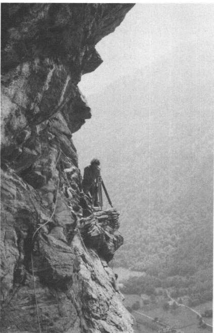
Abb. 4: Polaraufnahme mit Theodolit in steiler Wand; Sicherung mittels Seilgeländer.

Die eigentliche Vermessung bzw. Bauaufnahme erfolgt auf so winzigen und ausgesetzten Felsbändern zumeist auf Grund eines mit viel Improvisation errichteten orthogonalen (und allenfalls sogar gegenüber der Horizontalen geneigten) Axensystems aus gespannten Schnüren (Abb. 3), wogegen eine Polaraufnahme mit Theodolit und Messband (oder Reflektor) eher die Ausnahme darstellt (Abb. 4). Das System der Schnuraxen lässt sich auch auf die vertikale Ebene übertragen, indem man für Schnitte und Maueransichten Lote aufhängt und mit Wasserwaage oder Sitometer waagrechte Netzlinien anzeichnet. Messtechnisch recht schwierig wird es,