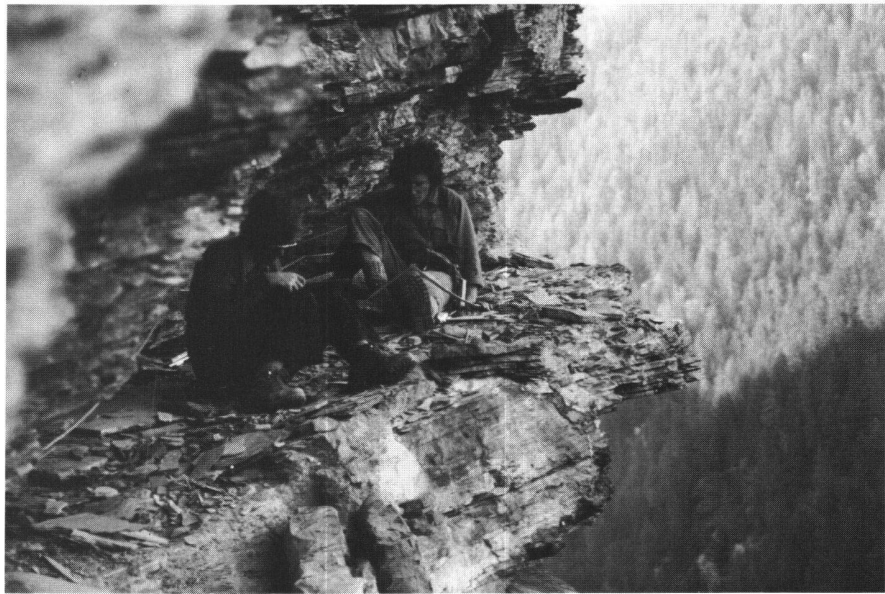
Abb. 3: Bauaufnahme mit Schnuraxen auf winzigem Balkon; im Vordergrund die (noch originalen) Balken zur Überbrückung einer Spalte.

Anlagen ist die «Grotte aux Fées» bei Hérémente im gleichnamigen Tal: ein zweiteiliger, unter gewaltigem Überhang in die Wand «geklebter» Bau, dessen einer Teil als weisser Kasten aus der Felswand herab leuchtet und damit so gar nicht den Eindruck eines Versteckes erweckt (Abb. 2). Wie man seinerzeit dorthin gelangt ist, mutet heute noch rätselhaft an; ein Zugang über inzwischen abgestürzte Felspodeste kann gerade noch erahnt werden; und dennoch wurden sogar Reste einer Truhe in einer Felsspalte gefunden! Zwei volle Tage waren nötig, um hier einen Zugang zu finden und mit Klettergeräten verschiedenster Art so einzurichten, dass auch der Materialtransport gewährleistet war. Denn es musste nicht nur die Vermessungs- und Photoausrüstung, sondern auch elektrischer Strom auf den Platz gebracht werden, um das Innere des Hüttchens für anspruchsvolle Photos ausleuchten und Bohrkerne für dendrochronologische Altersbestimmungen entnehmen zu können. Aus sieben datierten Hölzern liess sich dann eine Bauzeit um 1412 n. Chr. festlegen.