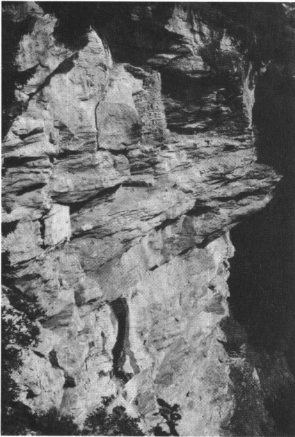
Abb. 2: Hérémente VS, «Grotte aux Fées», Ansicht von Süden; rechts Reste des oberen Baues (vgl. Abb. 5), links der fast intakte untere Bau aus Holz, vollständig mit weissleuchtendem Gips überzogen; Höhe der Wand gegen 100 m.