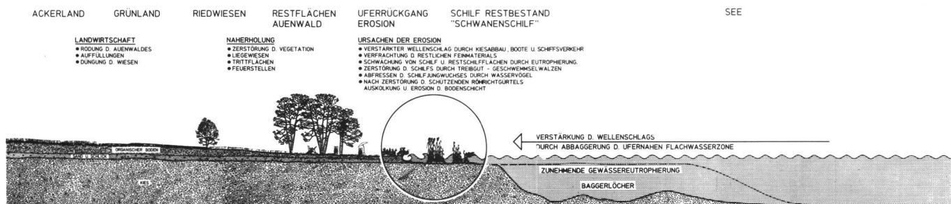
Plangrafik in der Landschaftspflege: Ursachen, Zusammenhänge und mögliche Entwicklungen aufzeigen.