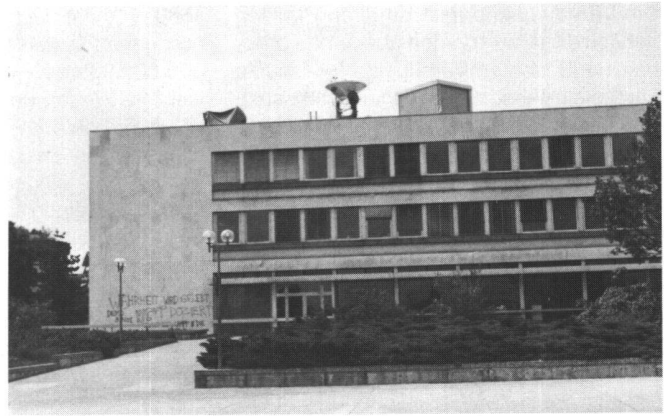
Abb. 7: Institut für exakte Wissenschaften seit 1962, der Gedenkstein befindet sich links hinter der Südecke.

Glücklicherweise wird dadurch wenigstens die praktische Vermessung nicht benachteiligt, deren Hauptpunkte bis anhin noch immer auf den Geländeerhebungen liegen bis hinauf zum höchsten Punkt der Schweiz. Auch das Astronomische Institut hat schon vor 30 Jahren für seine Sternwarte in Zimmerwald einen erhöhten Standort gewählt, wo heute zudem eine gutfunktionierende Station für die Satellitenbeobachtung steht. Für andere astronomische Messungen ist es neuerdings auch möglich mit einer transportablen automatischen Zenitkamera gleichzeitig die senkrecht über uns stehenden Sterne wie auch eine präzise Zeitangabe zu photographieren, um daraus die astronomische Länge und