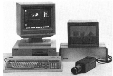
Abb. 2 zeigt das Videobildverarbeitungssystem Viper, welche drei Einsatzschwerpunkte hat: Bildausweitung, Bildbearbeitung und Mustererkennung.

Abb. 1 zeigt die Totalstation ET-1 von Topcon. Sie ist das Flaggschiff einer kompletten Gerätefamilie für die computerunterstützte und millimetergenaue Vermessung. Reichweiten von bis zu 2600 m, elektronische Winkelmessung, berührungsfreie Bedienung, automatische Kompensation der Erdkrümmung und externe Datenspeicher sind nur einige der vielen Vorteile.