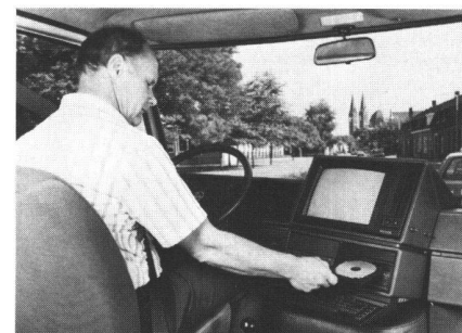
Fig. 3: Essai pratique de «Carin», à bord de la camionnette prévue à cet effet.

D'autres solutions à court terme sont à l'étude au centre de Geldrop, en vue de surmonter la difficulté du parasitage du champ magnétique terrestre par les objets ferreux.