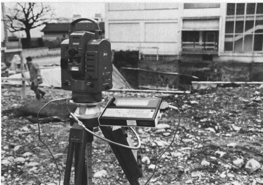
Fig. 2: Installation du Husky-Hunter avec un tachéomètre KERN E1.

gnes et 40 colonnes permettant l'utilisation de masques de saisie et de menus.