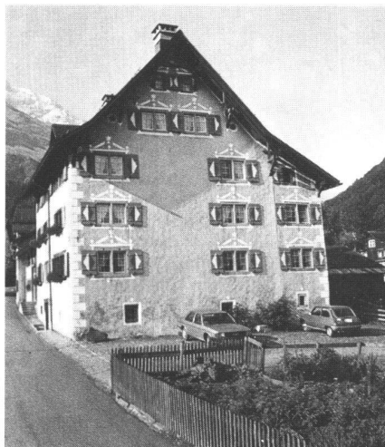
Abb. 1: Das Suworow-Haus.