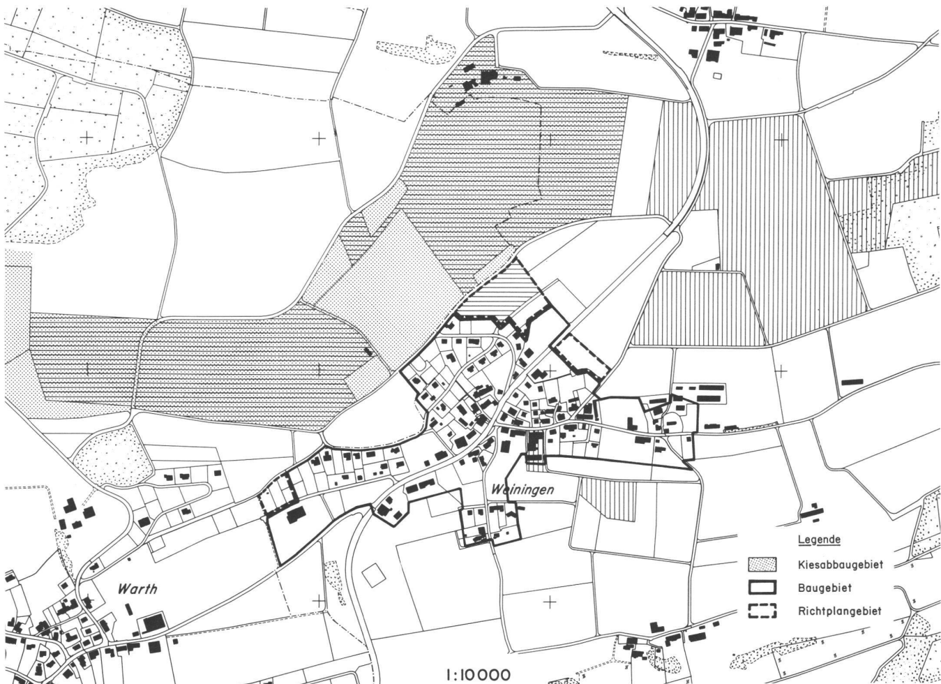
Abb. 3: Ausschnitt Neuer Besitzstand der Gesamtmelioration Warth-Weiningen TG. Landwirtschaftsbetrieb als Beispiel für die Entflechtung zwischen Bauland- und Landwirtschaftsinteressen. Kiesabbaubetrieb als Beispiel für die Entflechtung zwischen Landwirtschafts- und Kiesabbauinteressen.