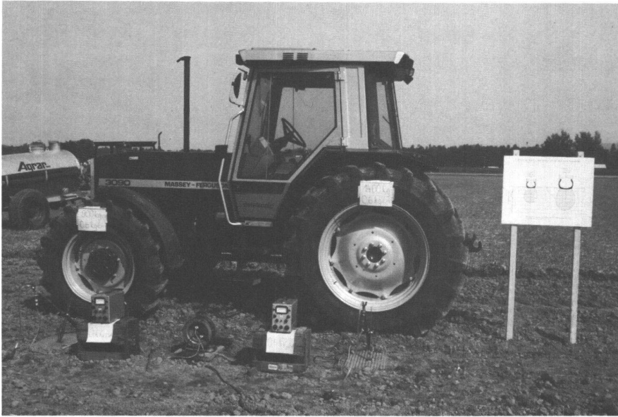
Abb. 1: Messung des Druckabbaus in 30 cm Tiefe bei unterschiedlicher Radlast und bei gleichem spezifischem Bodendruck (Kontaktflächendruck). Beispiel: