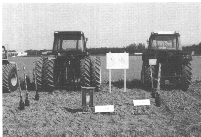
Abb. 2a + 2b: Unterschiedliche Bodenbelastung durch unterschiedliche Bereifung. Messung des Wasseraufnahmevermögens mit Infiltrationsrohren und des Eindringwiderstandes mit einem Penetrographen.