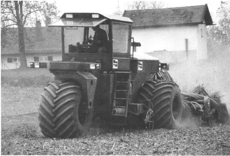
Abb. 3: Utopie oder Zukunft zur Bodenschonung?