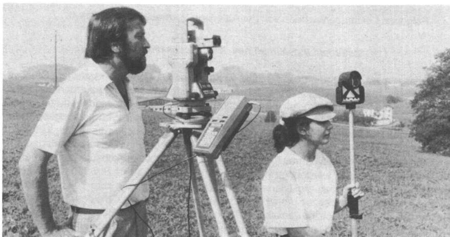
Fig. 1: Saisie des données avec des instruments de mesure modernes.

parcellaire, le plan d'ensemble et la mise à jour de ces documents.