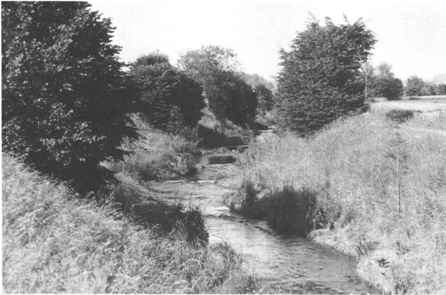
Abb. 2: Naturnaher, revitalisierter Bach.