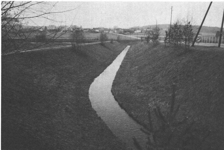
Abb. 3: Begradigter, längsverbauter, ökologisch armer Bach.

nieurs, des Agronomen, des Verkehrsplaners betreffen in der einen oder anderen Form die natürliche Umwelt. Jedoch ist der Umweltbezug bei den Tätigkeiten des Kulturingenieurs, denkt man z.B. an die Landumlegung oder den Wegbau oder die Bachkorrektur, besonders eng. Der Kulturingenieur trägt eine besondere Verantwortung für Umweltbelange. Da er mit seinen Instrumenten sehr tief in die Landschaft (Siedlungs- und Nichtsiedlungsgebiet) eingreift, diese z.B. um- und neugestaltet, muss ihm der Natur- und Landschaftsschutz als auch der Ortsbild- und Denkmalschutz ein Anliegen sein. Wie die Abbildungen 2 und 3 zeigen, ist z.B. Bachverbauung nicht gleich Bachverbauung. Der Kulturingenieur ist aber kein Ökologe, er ist in diesem Sinne nicht ein Spezialist des Umweltschutzes; aber er sieht die