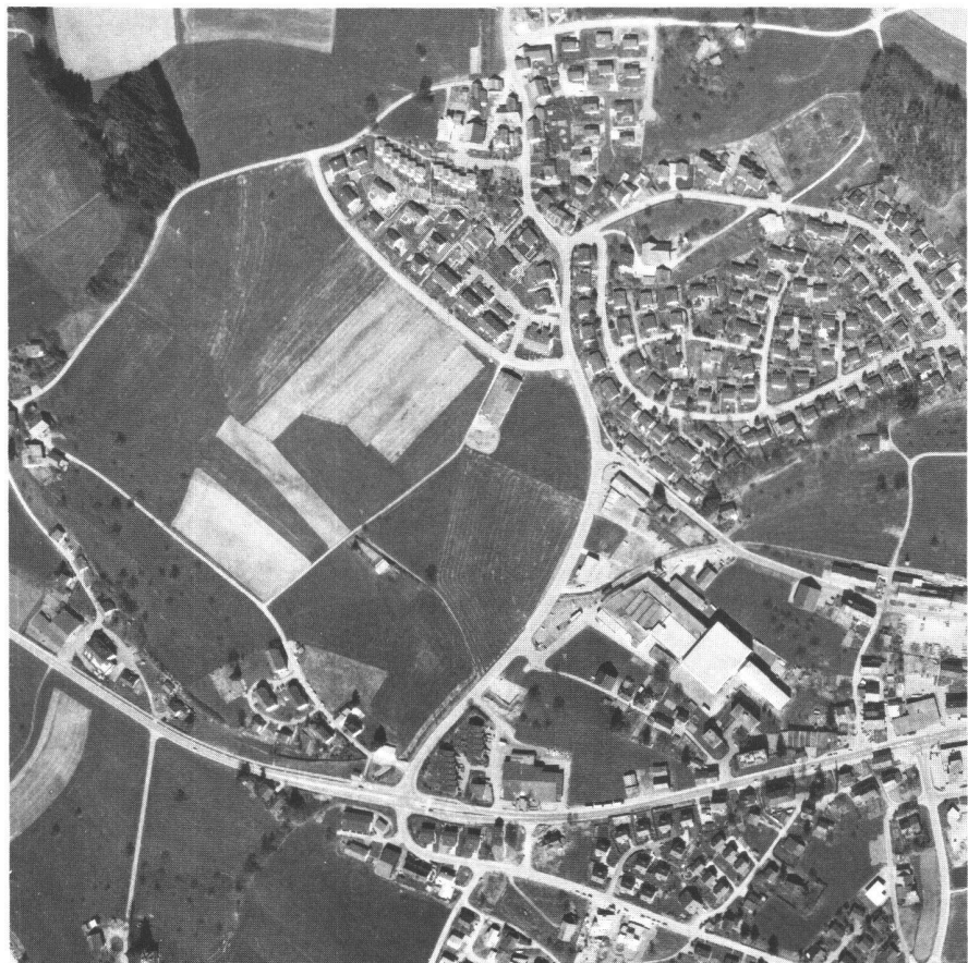
Abb. 1: Blick auf Wolfhausen, Gemeinde Bubikon (ZH). Das gesamte Kulturland zwischen den bestehenden Häusern und dem Wäldchen war als Industriezone eingezont.

Im Mai 1986 hat die Volkswirtschaftsdirektion der Schweizerischen Vereinigung für Industrie und Landwirtschaft (SVIL), Zürich den Auftrag zu einer «Quartierplanstudie Industrie- und Wohnzone Süd, Wolfhausen» erteilt. Im Auftrag wurde festgehalten: