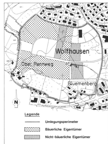
Abb. 3: Beizugsgebiet Entflechtungs-umlegung. Auszonungswillige Eigentümer mit Entschädigungsverzicht.

Für alle diese Grundstücke der beiden genannten Gruppen wurden schriftliche Erklärungen eingeholt. Diese beinhalten das