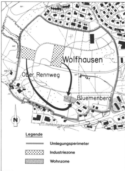
Abb. 4: Eigentümer mit Tauschvertrag. Industriezone – Wohnzone.

Gesuch um Umzonung der bezeichneten Parzelle von der Bauzone in die Landwirtschaftszone (siehe Abb. 3) und ein Entschädigungsverzicht unter dem Vorbehalt, dass die aufgelaufenen Quartierplanungskosten für die auszuzonenden Flächen anderweitig übernommen werden.