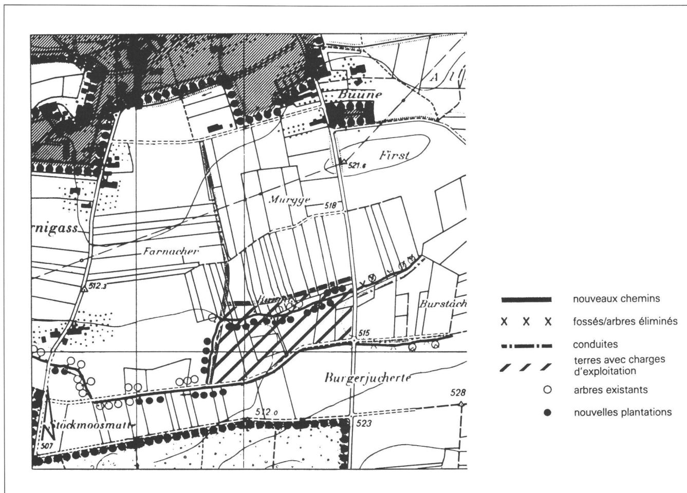
Fig. 3: Extrait d'un avant-projet (conflit protection du paysage/agriculture résolu). [Les figures sont tirées de: Protection de la nature et du paysage lors d'améliorations foncières Guide et recommandations 1983 OCFIM, Berne.]

parfois farouche, à préserver et défendre des conceptions étroites. A l'heure de l'Europe, il serait temps d'élargir son horizon.