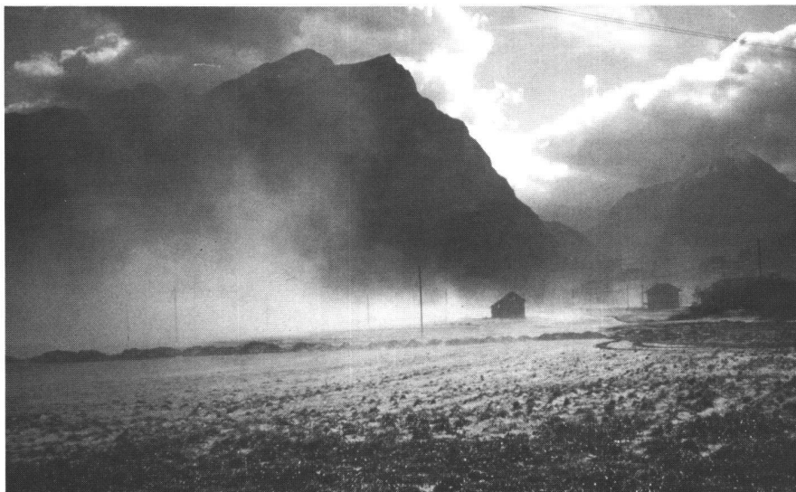
Abb. 1: Auf den noch nicht rekultivierten Flächen bildeten sich bei Föhn Sandstürme.