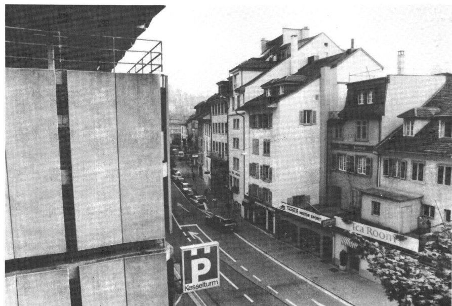
Abb. 1: Zerstörung des Stadtbildes durch nicht angepasste Bauten.

Betrachtet man Funktion und Definition einer Stadt, wird deutlich, welchen Entwicklungen diese unterworfen waren: