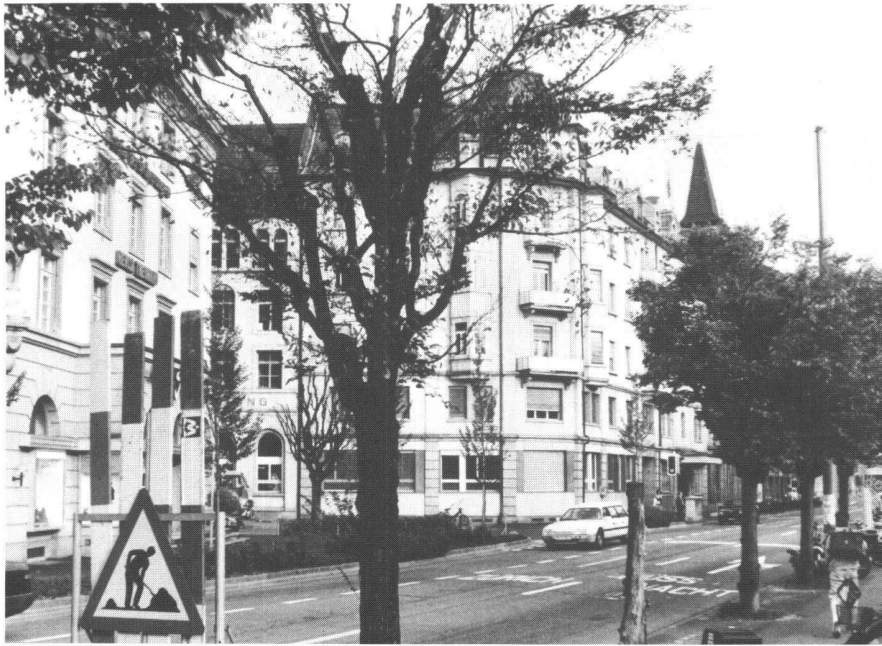
Abb. 2: Kranke und absterbende Bäume in der Stadt.

Bei Aristoteles ist die Stadt ein Platz, «wo Menschen ein gemeinsames Leben führen zu einem vornehmen Zweck und Ziel»,